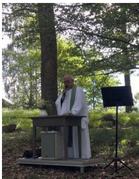
Friluftsgudstjänst i Janssons park