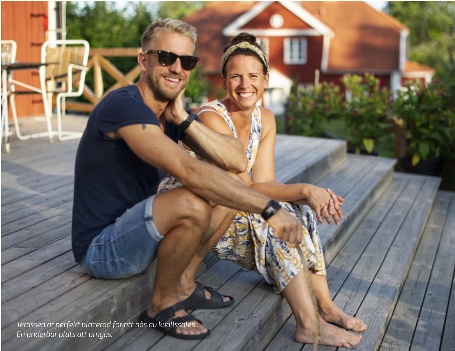
Terassen är perfekt placerad för att nås av kuällssolen. En underbar plats att umgås.

nya körprojektet ”The Rockin’ Pots” i Norrköping, en integrationskör dit alla är välkomna.