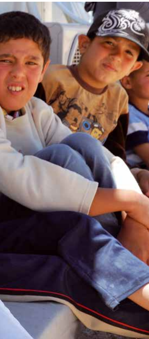
och det blir alltid bråk, säger hon.