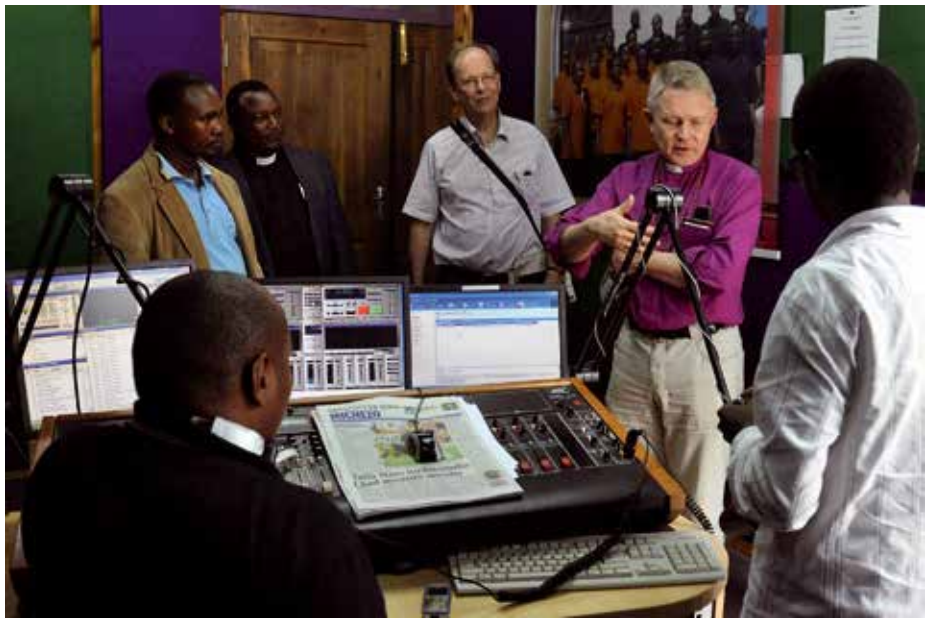
Ärkebiskop Anders Wejryd på kyrkans radiostation i Dar es Salaam, vid ett besök i landet 2011.