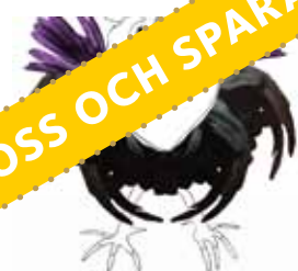
Jesus: »Innan tuppen gal i natt har du förnekat mig tre gånger.» LUK 22:61