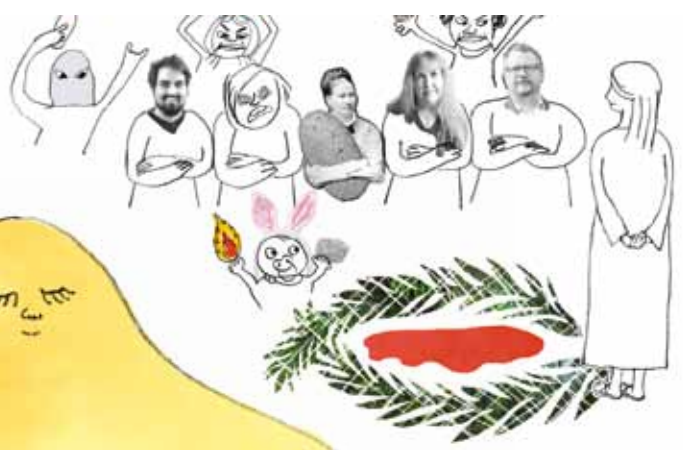
Folkhoppen: »Korsfäst, korsfäst honom!» LUK 23:11