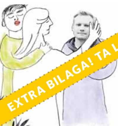
Jesus: »Judas, förräder du Människosonen med kysst?» LUK 22:48