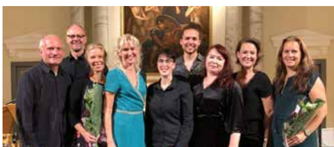
Biljettförsäljningen och kollekten från välgörenhetskonserten "Spela för livet" 15 sept gav ett bidrag till Cancerstiftelsen i Kronobergs län på 36 400 kr. Stort tack!