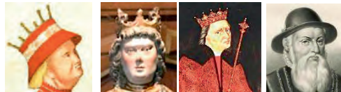
Kristofer av Bayern, Karl Knutsson Bonde, Kung Christian I, Sten Sture d.ä.