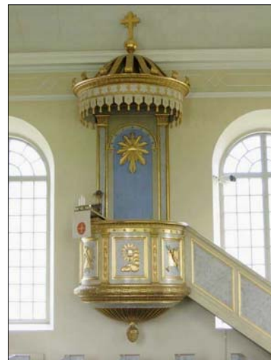
Dopfunten av "Bestiariustyp" (omkring 1150) från gamla kyrkan, orgeln av Sven Nordström från 1856-57 och predikstolen av A Stridsberg från 1855.