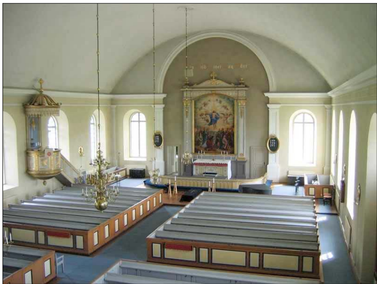
Långhuset präglas av tätt sittande rundbågiga fönster, den markerade altaruppsatsen och i övrigt ett mycket välbevarat skick.