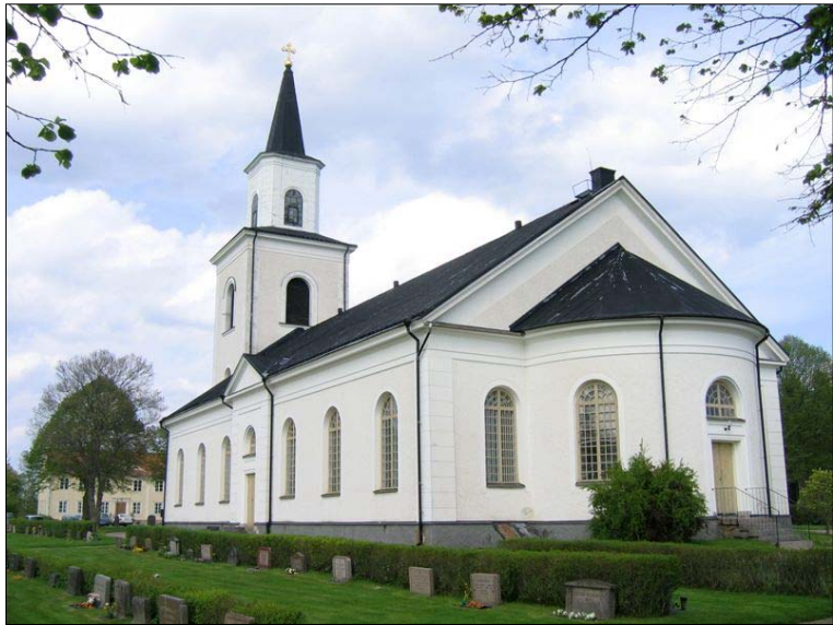
Flisby kyrka från söder. Sidoingången på västra långsidan är tydligt markerad med framskjutande parti som kröns av frontespis.