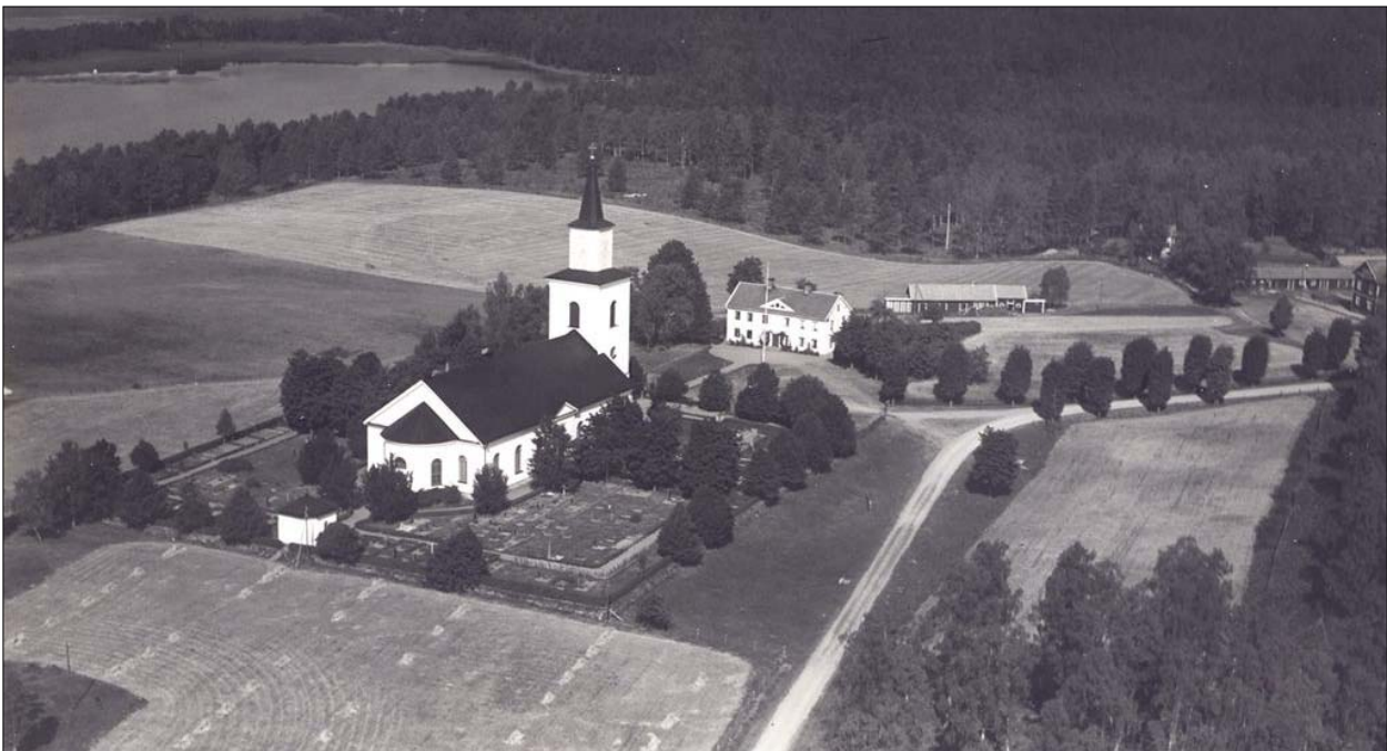
Flisby kyrka ligger i nordsydlig orientering, norr om kyrkan skolhuset från 1853 och därbakom kyrkstallarna. Flygfoto från 1935.

Flisby socken ligger på småländska höglandet i sydvästra delen av Linköpings stift. Socknen är den nordligaste i Nässjö kommun. I norr gränsar den till Bälaryd och Bredestad i Aneby kommun, i söder till Norra Solberga som är huvudkyrka i samfälligheten med samma namn, och i väster gränsar socknen till Barkeryd och i öster till Askeryd. Kyrkan ligger utmed vägen mellan Aneby och Norra Solbergas båda kyrkor. Det som idag är själva samhället Flisby ligger ca fem km nordväst om kyrkan, det uppfördes som ett stationssamhälle när järnvägen drogs fram 1874. Flisby kyrka med omgivning utgör ett välbevarat sockencentra. Den gamla kyrkan revs några år efter det att den nuvarande kyrkan stod färdig. Ruinerna finns kvar sydväst om kyrkan där också en ödekyrkogård finns. I kyrkans närhet finns ett stort antal fornlämningar i form av gravfält – det största ligger direkt söder om kyrkan och härrör från järnåldern. Ytterligare en bit från kyrkan i samma riktning prästgården (ursprungligen 1767) och en hembygdsgård med enkelstuga (ca 1750), loftbod (ca 1780) samt ladugård (ca 1850) – samtliga ditflyttade sedan 1939. Norr om kyrkan ligger skolhuset som uppfördes i empirestil 1853 och tjänar nu som församlingshem. Kyrkan är närmast omgiven av kyrkogården med häckar och järnräcken. På kyrkogården finns även ett gravkapell söder om korabsiden.