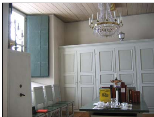
Interiörbild från sakristian som flankerar koret.