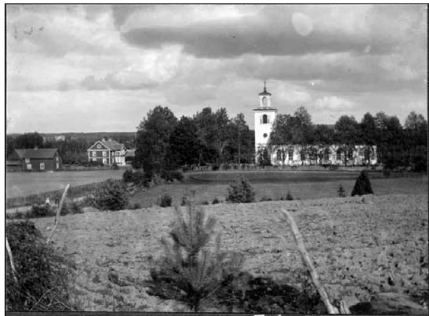
Vy mot kyrkan. Foto O Blomstrand okänt datum. (ATA)

En orgel införskaffades tidigt till kyrkan, den tillverkades 1841 av orgelbyggaren Sven Nordström i Norra Solberga. Orgeln placerades på läktaren längst bak i långhuset. Efter 25 år var orgeln i behov av justeringar vilka utfördes av samme Nordström som byggde den. År 1892 installerades kaminer för kyrkans uppvärmning och 1906 plockades den ursprungliga altarprydnaden ner och ersattes med den gamla kyrkans altaruppsats från 1673.