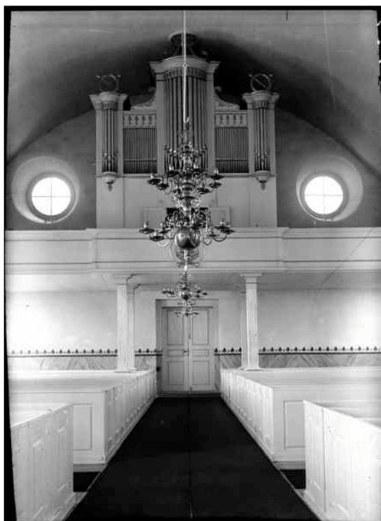
Vy mot orgelläktaren. På bilden syns den målade brösthning som tillkom 1928. Foto E Erics 1938. (ATA)

I slutet av 1970-talet byttes alla ytterbågar ut mot nya som glasades med det gamla glaset i blyspröjsar. År 1983 plockades altarkrucifixet från 1960-talets restaurering bort och altaruppsatsen från 1600-talet placerades åter på altaret, fem år senare renoverades Nordströmsorgeln efter ett program av orgelkonsult Carl-Gustaf Lewenhaupt. Den senaste restaureringen utfördes 2004 då innertaket torrenjordes och väggarna avfärgades invändigt, förgyllningen i pilastrar och pelare rengjordes och korgolvet slipades och lackades.