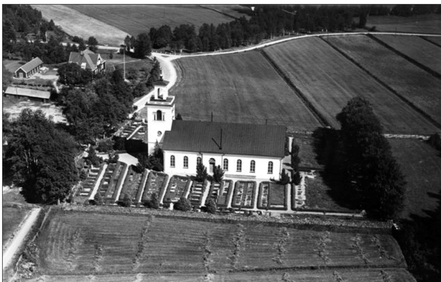
Hult flygbild 1936. (JLM)