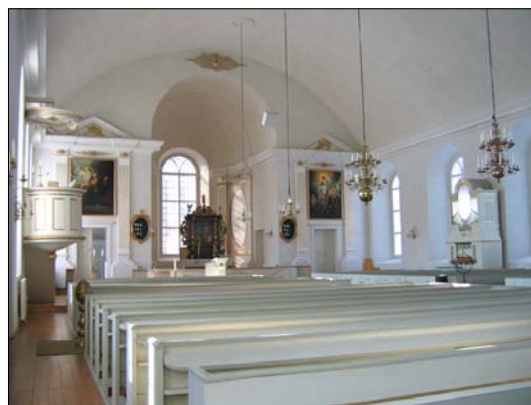
Kyrkorummet präglas av en ljus färgskala i grått och guld. Inredningen är i stort den ursprungliga men i kyrkorummet finns äldre inredning och inventarier som tidigare funnits i den medeltida kyrkobyggnaden.

Sakristian och förrådsutrymmet har trägolv, slätputsade väggar med vit avfärgning. Taket i sakristian har en modern panel som laserats, i förrådet är det ett målat brädtak. Fönstren har helglasade innerbågar och det sitter stålkädda fönsterluckor för fönstren. I de rum som inordnats i läktarunderbyggnaden är det trägolv i den ena och en heltäckande textilmatta i den andra. Väggarna är putsade eller panelväggar, vitmålade. I det östra rummet är en toalett inrymd. Taket är målade brädtak och dörrarna utgörs av fyllningsdörrar som är målade i grå nyanser. Tornet har grovputsade väggar och obehandlade träkonstruktioner. Till orgelläktaren sitter skivklädda dörrar.