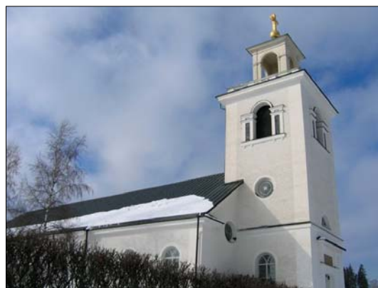
Kyrkan har alla de attribut förknippade med den nyklassicistiska kyrkan där lanternintornet är ett av de främsta.

taklist. Sidoentréerna har svagt framskjutande risaliter med ovanliggande lunettfönster, huvudentrén är tornentrén i söder vilken har pilasterinramning och en kraftig överliggare. Ovanför tornporten sitter en minnestavla. Kyrkportarna är pardörrar, fyllningsdörrar. Fönsteröppningarna är rundbågförmiga och tätspröjsade med blyspröjsar. I nordgaveln sitter ett lunettfönster och vid den södra är två rundfönster upptagna. Tornkroppen har ett lunettfönster ovanför kyrkporten och rundfönster. Alla rundfönster har intrikat spröjsning. Fönster- och dörrsnickerierna är målade i en ljus grå kulör. Ljudluckorna i tornet är inskrivna i bågar med dubbla pilastrar.