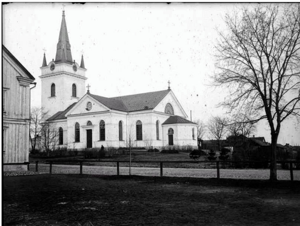
Eksjö kyrka med den ursprungliga tornspiran ritad av J F Åbom 1877, uppförd 1887. Spiran ersatt av lanternin 1925. Foto: ATA, okänt årtal.