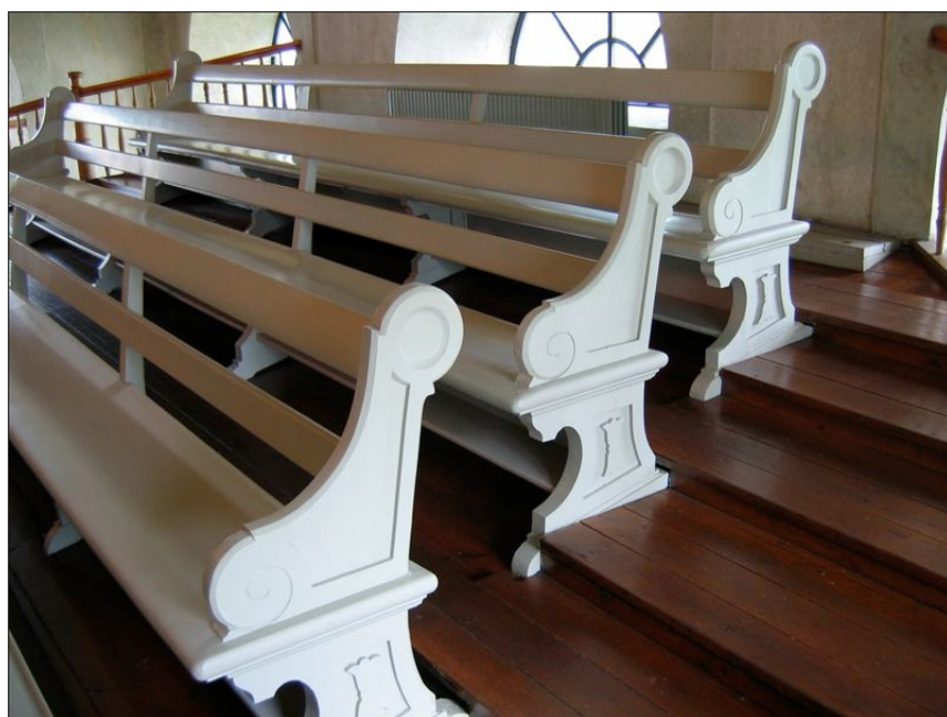
Ursprunglig bänkinredning från 1889 finns bevarad på läktarna, även golvet här på södra läktaren är ursprungligt.