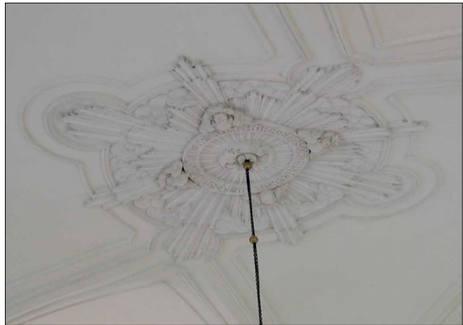
Takrosett över koret, utförd av Allan Norblad 1912.

De bevarade inventarierna från gamla kyrkan har ett mycket stort kulturhistoriskt värde, både som konstnärliga objekt men också som historiska och rumsliga, det är huvudsakligen utifrån dessa som senare restaureringar har utgått. På kyrkans tornvind och i källaren bevaras många äldre inventarier tagna ur bruk, både från den numera rivna barockkyrkan och den nuvarande kyrkan, som har ett stort konsthistoriskt värde. Dessa är även viktiga för kunskapen om kyrkans historia. Kyrkan har det ursprungliga och mekaniskt drivna urverket från 1889 kvar i drift vilket numera hör till ovanligheten.