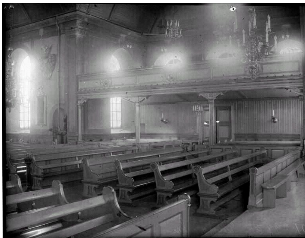
Norra korsarmen fotograferad före 1912 års restaurering. Väggar är boaserade, tak panelklätt, ursprungliga bänkar och färgsättning i "brungrått".