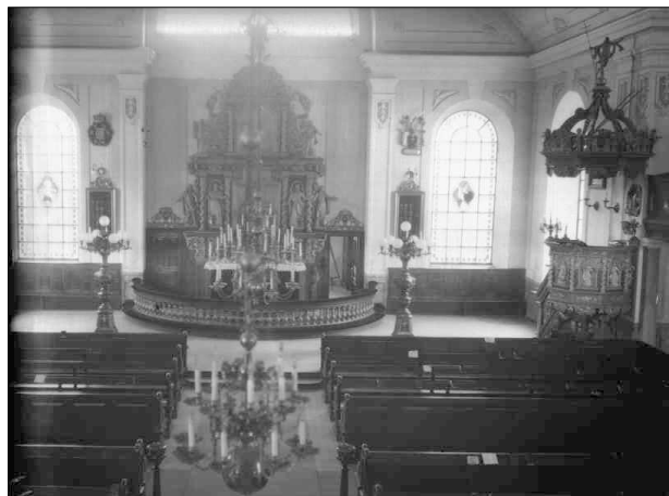
Fotografi över koret med de ursprungliga korfönstren och gjutjärnskandelabrar. Taket försågs med stuckatur 1912. De bemålade korfönstren murades igen 1943.

Efter den senaste renoveringen som var klar 2001 är dagens kyrkorum ett resultat av flera olika renoveringsepoker. Dessa sammanhålls av en harmonisk färgskala och en strävan efter en stilistisk samstämmighet som det ursprungliga kyrkorummet i viss mån saknade, och redan tidigt valde man att anknyta tillbaka till den rivna barockkyrkan. Altaruppsatsen och predikstolen från 1698 av mästaren Anders Ekeberg har konserverats vid flera tillfällen. Den nuvarande, mer barocktrogna, färgskalan från restaureringen 1943, är mjukare och harmonierar bättre med väggarnas marmorering än de underliggande färglagren. Bevarade från gamla barockkyrkan är även två epitafier (av samme Ekeberg respektive J Künkel som målade det gamla brädtaket), musicerande änglafigurer under läktarna, några hu-