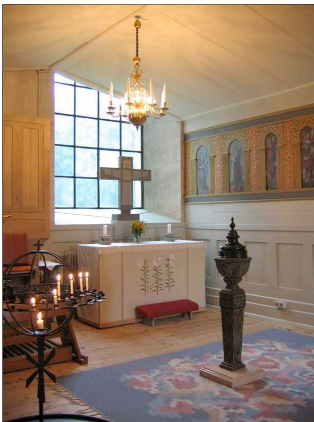
Ett andaktskapell inreddes i norra korsarmen 1971, detta flyttades 2001 till södra korsarmen. Här finns också dopfunten av röd kalksten från 1659 och den gamla kyrkans läktarbröstningar på väggen mot trapprummet.

Kyrkans stora orgel härrör också från den tidigare kyrkan. Orgelfasaden gjordes av J Wistenius omkring 1760, och fick 1867 ett orgelverk av bröderna Nordström. Nordströmorgelns orgelverk byggdes om 1939, och 1967 fick den ett helt nytt orgelverk och ryggpositiv byggd av Olof Hammarberg.