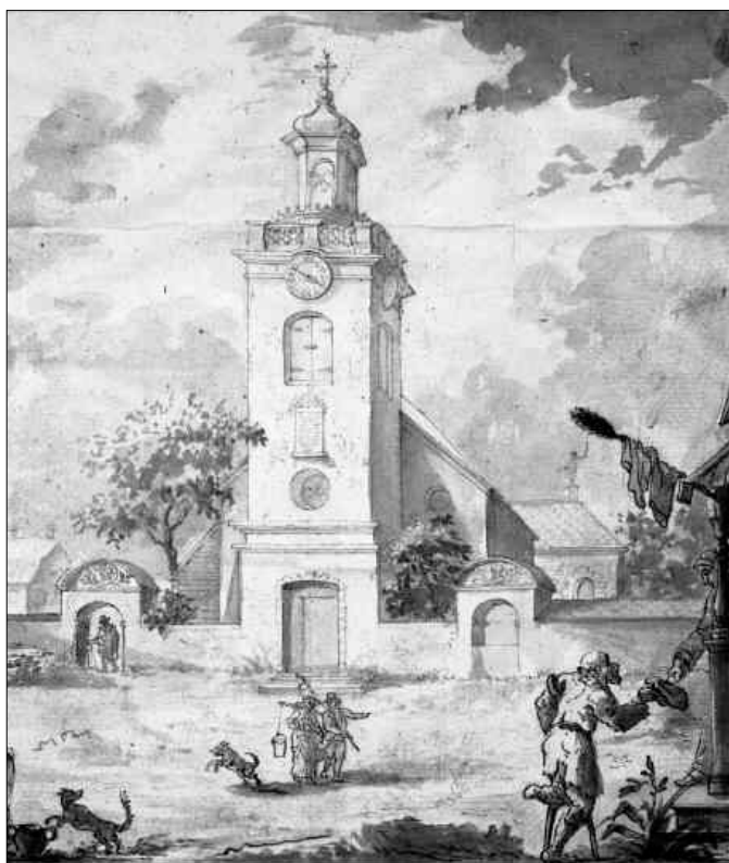
1784 års torn sammanbyggt med bogårdsmuren. Tuschlavering (något beskuren) från 1700-talets slut av C V Svedman.

På 1870-talet sågs barockkyrkan som omodern och i dåligt skick, så ritningar till en ny kyrka framtogs av Överintendentsämbetets arkitekt J F Åbom. Ritningarna var klara 1877 men godkändes först 1886 efter att man även hade diskuterat ett alternativt förslag från arkitekten Carl Möller. Dock valde man till slut ändå Åboms ritningar och kyrkobygget inleddes 1887 genom att den gamla kyrkan först revs. Vid