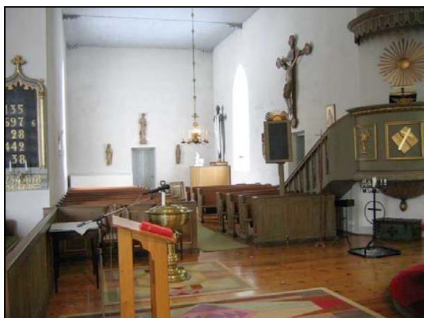
Östra respektive västra korsarmen.