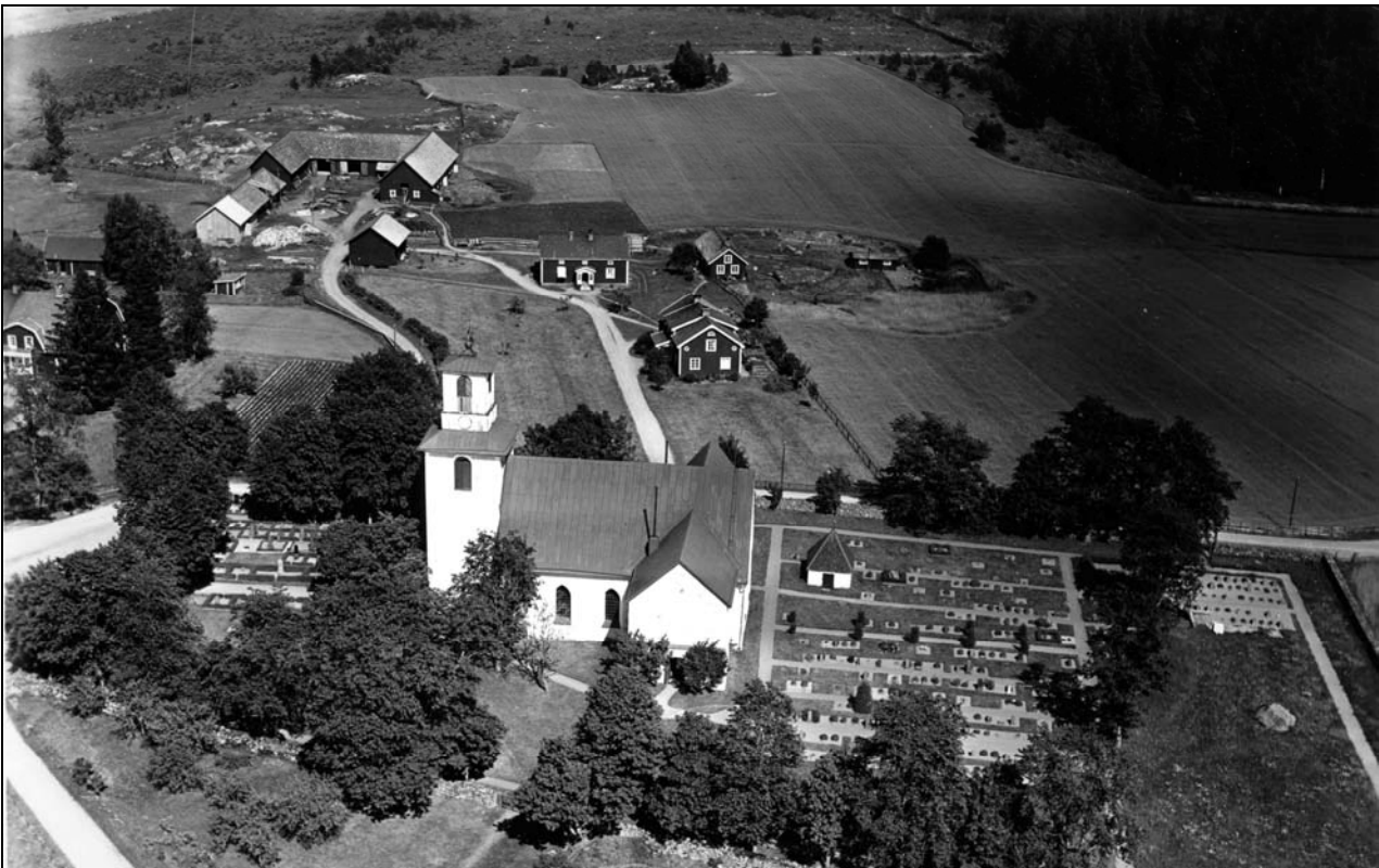
Flygbild över Höreda kyrka och kyrkogård från 1936. Foto mot öster. JLM.

Kyrkan är orienterad i nord-sydlig riktning och omgiven av en kyrkogård. På kyrkogården finns även ett gravkor söder om kyrkan. Kyrkan och kyrkogården ligger i en trevägskorsning, vid denna korsning finns även prästgård, skolbyggnad från 1900-talets senare del samt kyrkstallar och ett sockenmagasin i timmer. Sydväst om kyrkan ligger hembygdsgården på den gamla klockarejorden.