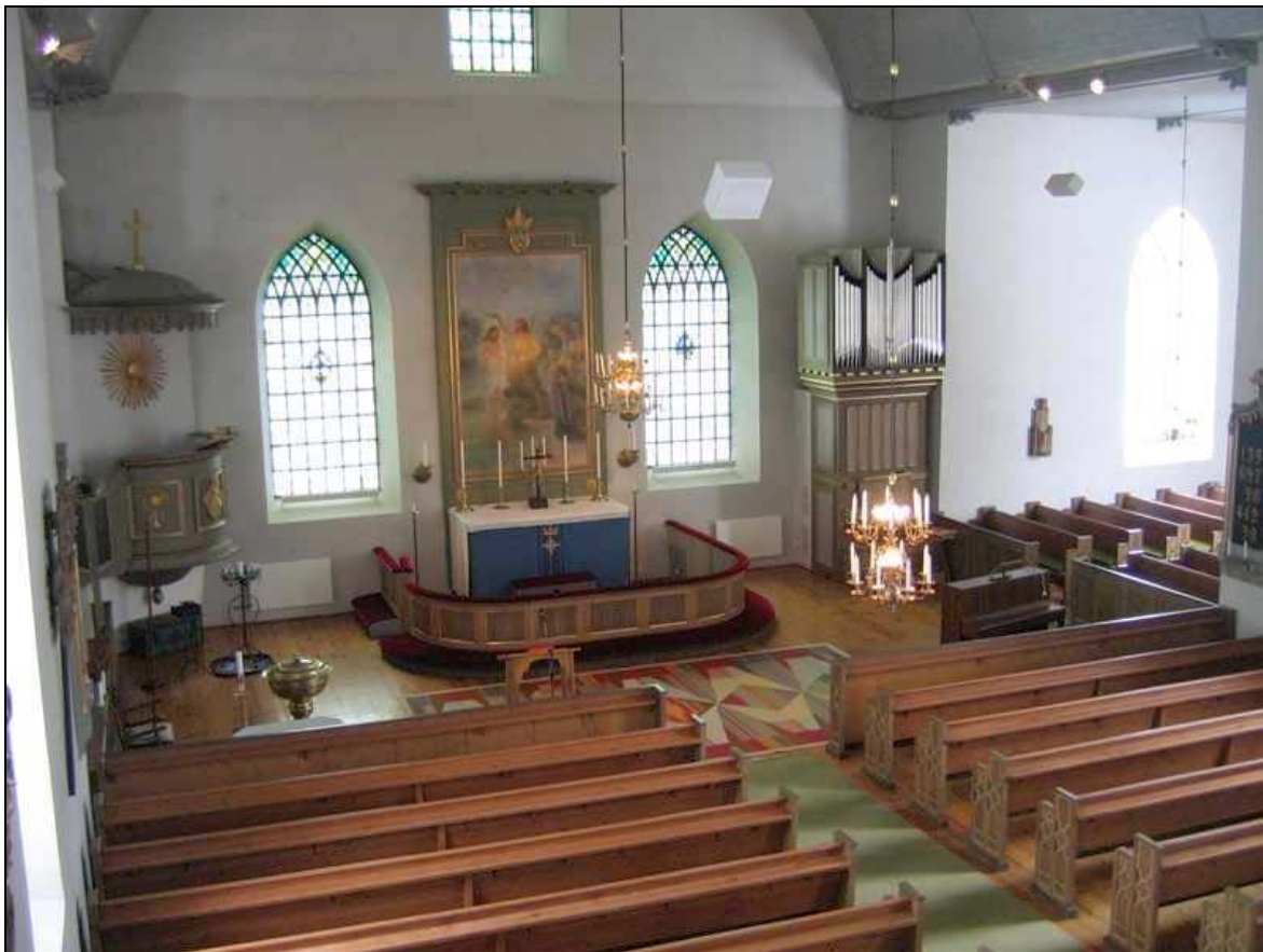
Koret i Höreda kyrka, fotograferad från norr.

Inredningen följer inte någon enhetlig stil utan minner istället om flera tidsepoker som varit betydelsefulla för kyrkan. På väggarna i främst gamla delen av kyrkan hänger flera medeltida träfigurer – både bemålade och nästan trärena. Kyrkans nuvarande disposition som korskyrka minner om 1700-talets befolkningsökning då det norra skeppet byggdes, i övrigt är spåren från denna tid få. Predikstolen som är målad i heltäckande grönt med förgyllda enkla symboler i speglarna minner om nyklassicistiska stilideal från 1800-talets början. Orgelfasad, nummertavla, bänkinredning, takbjälkarnas utsirade ändhuvuden, balusterdockor på trappräcken till läktare och predikstol är typiska uttryck för det sena 1800-talet, liksom pärlspontstaket. Kyrkans altare med altartavla och glasmålningar bär tidstypiska vittnesmål om 1920- och 30-tal. Bänkgavlarna förenklades vid samma tid genom att det övre treklöverkorset sågades av, färger skrapades av och laserades istället i grönt. Bänkskärmarna har samma enkla spegelindelning som altarrundeln, som nästan är helt trären bortsett från en målad guldlister och en svag lasyr.