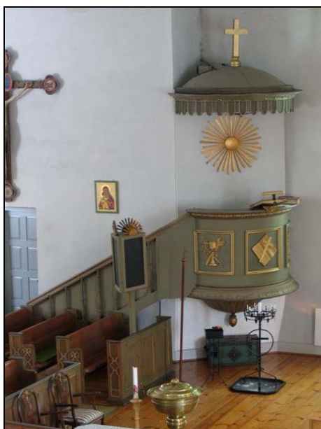
Predikstol från 1829