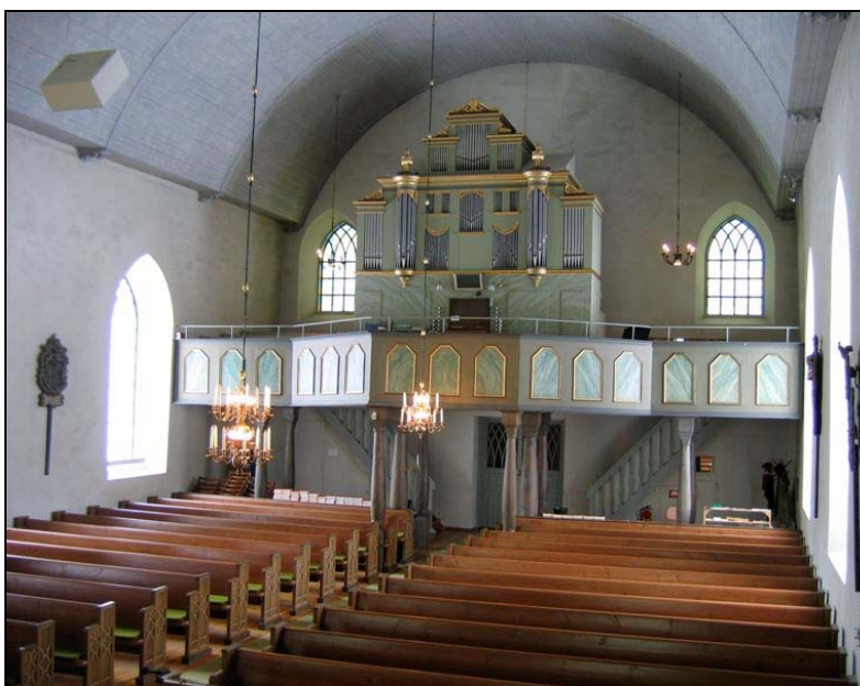
Norra korsarmen, vy mot norr.