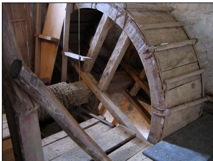
Uppfodringshjulet i tornet är välbevarat och visar hur kyrktornet byggdes.