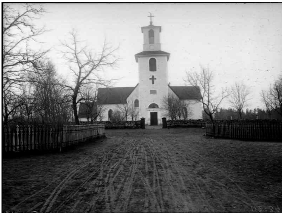
Höreda kyrka fotograferad från norr 1894.

Ursprungskyrkan var liksom dagens kyrka uppförd av gråsten som putsats och vitkalkats. Vid något eller några tillfällen utvidgades kyrkan troligen mot öster med ett