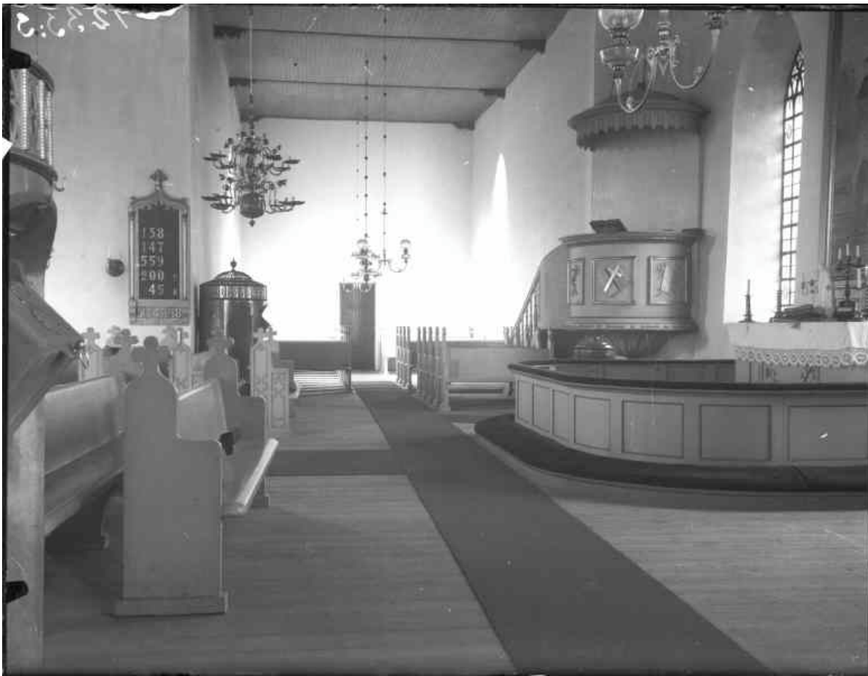
Östra korsarmen och koret, fotograferat efter det att glasmålningarna monterats i koret. Kyrkbänkarna saknar bänkskärmar och har kvar sina treklöverkors. Kaminen vid norra väggen är nu flyttad till Edshults kyrka.

Kyrkan har troligen varit täckt med spån sedan den byggdes och var så också fram till 1898 då spåntäckningen ersattes av ett plåttak. Under 1900-talet har främst tre händelser varit betydelsefulla; 1927 byttes det nyklassiska altarkorset med törnekrona och svepeduk ut mot en nymålade altartavla av Isidor Törnström, 1933 gjordes en omfattande inre renovering då all träinredning målades om, gavlarna på bänkarna förenklades och en del äldre inventarier sattes upp i kyrkorummet igen. Efter denna renovering gjordes en ny 1972 då man förutom takomläggning och utvändigt ommålning också målade om invändigt. Dagens invändiga färgsättning med nästan trärena ytor på bänkinredning och altarrundel i svagt laserande toner kommer från denna renovering.