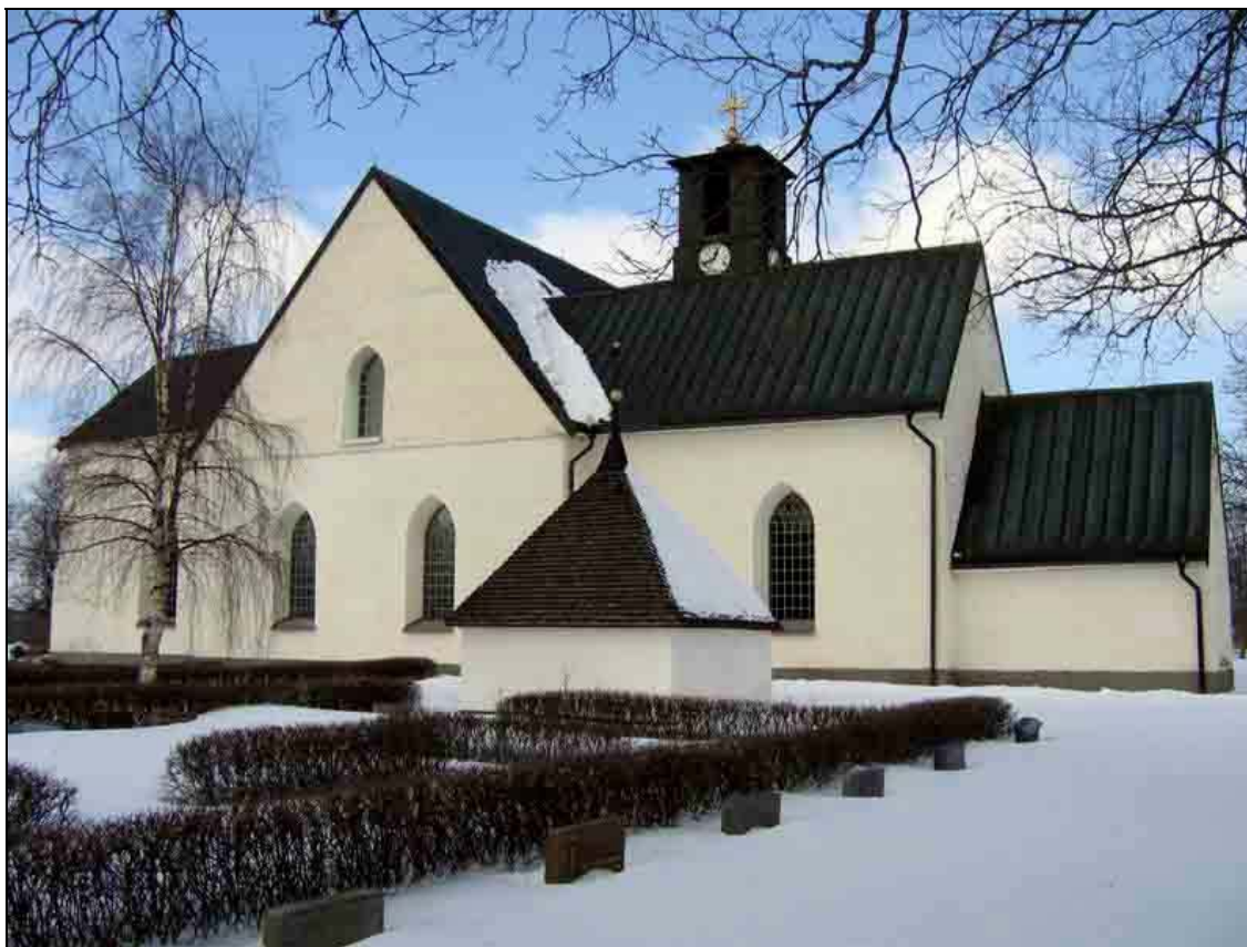
Höreda kyrka fotograferad från söder.

Kyrkan är uppförd av gråsten som putsats och kalkmålats. Fasaderna är slätputsade, på de äldre delarna med synlig följsamhet mot gråstensstommen, men tornet är spritputsat med utsparade omfattningar kring fönsteröppningar och runt hörnen. Sockeln är låg, spritputsad och målad i grått, tornet saknar sockel. Östra korsarmen är något lägre än västra, vilket troligen visar