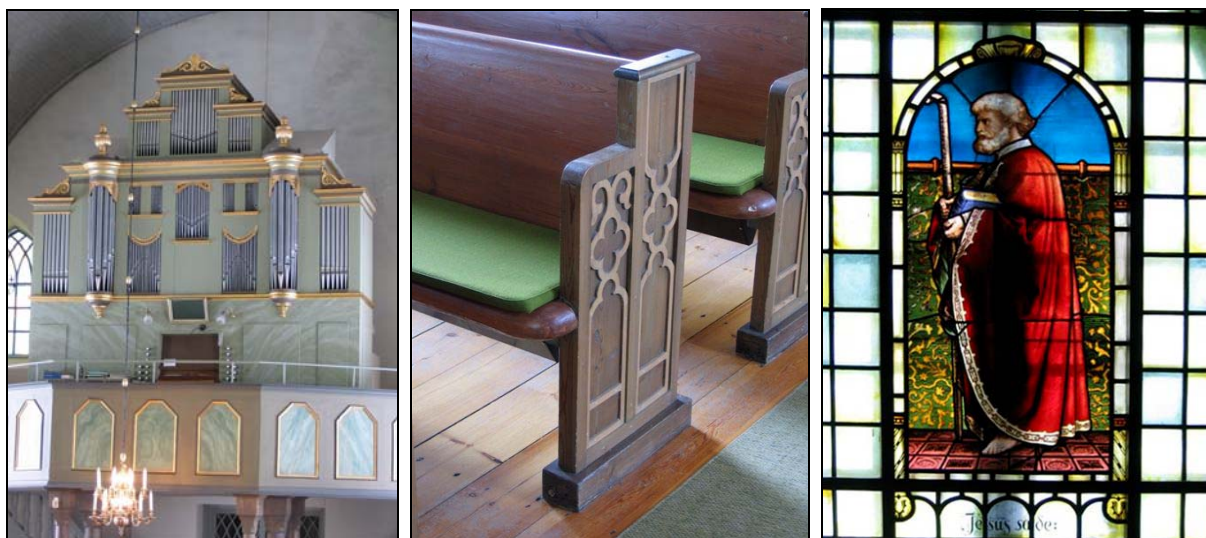
Orgeln tillverkad av Eric Nordström 1883, bänkgavlar i nygotik tillverkade av kyrkans egen kantor på 1880-talet samt en glasmålning i sakristian som också härrör från 1880-talet men insatt 1930.

Utrymmet under orgelläktaren är till skillnad från många andra kyrkor inte inbyggt vilket förknippas med ursprunglighet och autenticitetsvärden. Även tornet är välbevarat och innehåller dessutom det hjul som användes vid bygget av tornet och installationen av kyrkklockorna. Liknande hjul finns inte bevarat i någon annan kyrka i länet och har ett stort teknikhistoriskt värde. Orgeln är från 1883 och är efter en restaurering på 1960-talet i välbevarat, nästan ursprungligt skick.