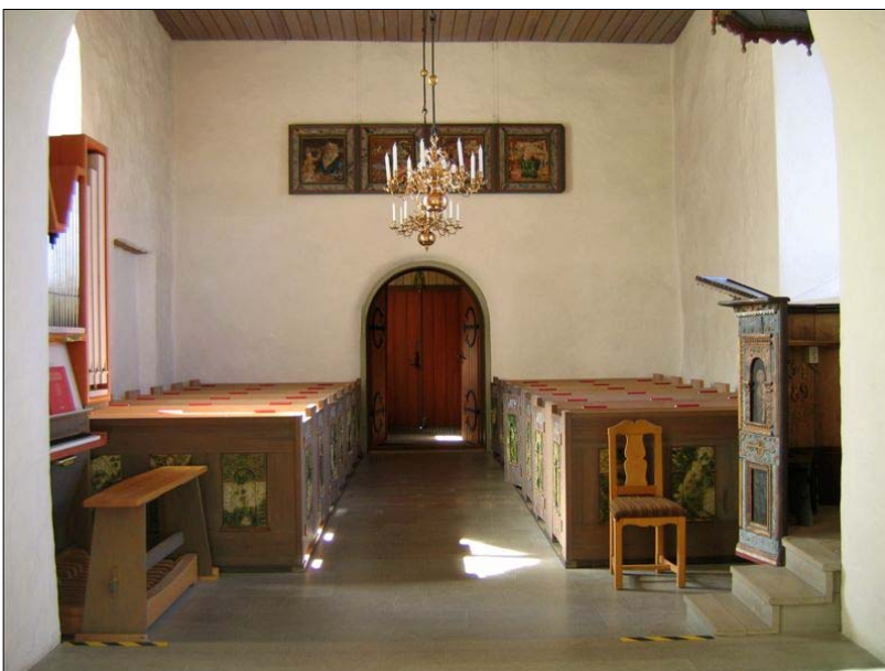
Västra väggen är en fri men trovärdig rekonstruktion från 1902 då långhuset i trä revs. Över ingången hänger paneler från läktarbröstningar målade av Nils Ahlstrand.