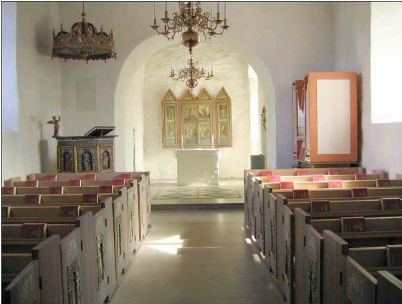
Långhus och kor, med altarskåpet från 1600-talet i fonden. Kyrkan har en tydligt medeltida rumslighet, men även en spartansk, modern karaktär.

Förutom de nämnda spåren i kyrkans medeltida murverk och stomme är dess långa historia främst tydlig i inredning och inventarier. På korväggen bakom det moderna altaret hänger ett altarskåp från 1600-talet, med fyra bibliska scener samt de fyra evangelisterna. I hörnet mellan kor och norra långhusväggen står predikstolen från 1661 som skänktes i samband med första utvidgningen åt väster. Bänkinredningen är nytillverkad från 1970 men i dörrarna har speglarna i den gamla bänkinredningen tillvaratagits. Av ny fast inredning märks den modernistiska dopfunten i kalksten (1971) samt den samtida orgeln från J. Künkels orgelverkstad. Orgeln är ritad av Kurt von Schmalensee.