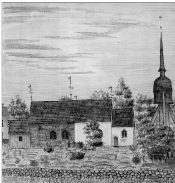
Teckning av kyrkan omkring 1800-talets mitt, ur Ihrfors Smolandia sacra ATA