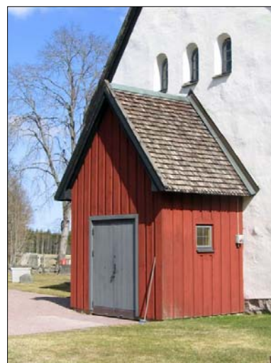
Vapenhuset från 1971 på den rekonstruerade västra väggen.

Invändigt präglas kyrkan av ombyggnaden som gjordes i samband med att kyrkan åter blev gudstjänstlokal 1971.