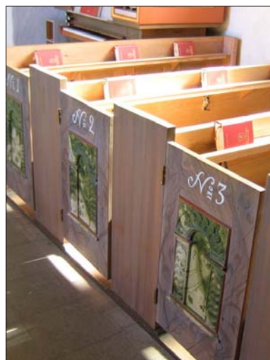
Predikstol i barockstil från 1661, modern dopfunt från 1971 i kalksten och bänkkvarter också ifrån 1971 med bevarade dörrspeglar från den äldre inredningen.