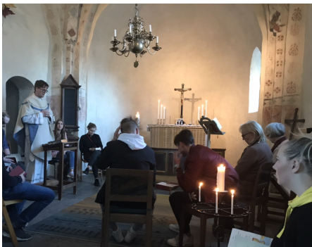
Veckomässa i Balingsta