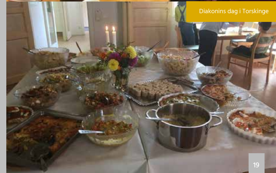
Diakonins dag i Torskinge