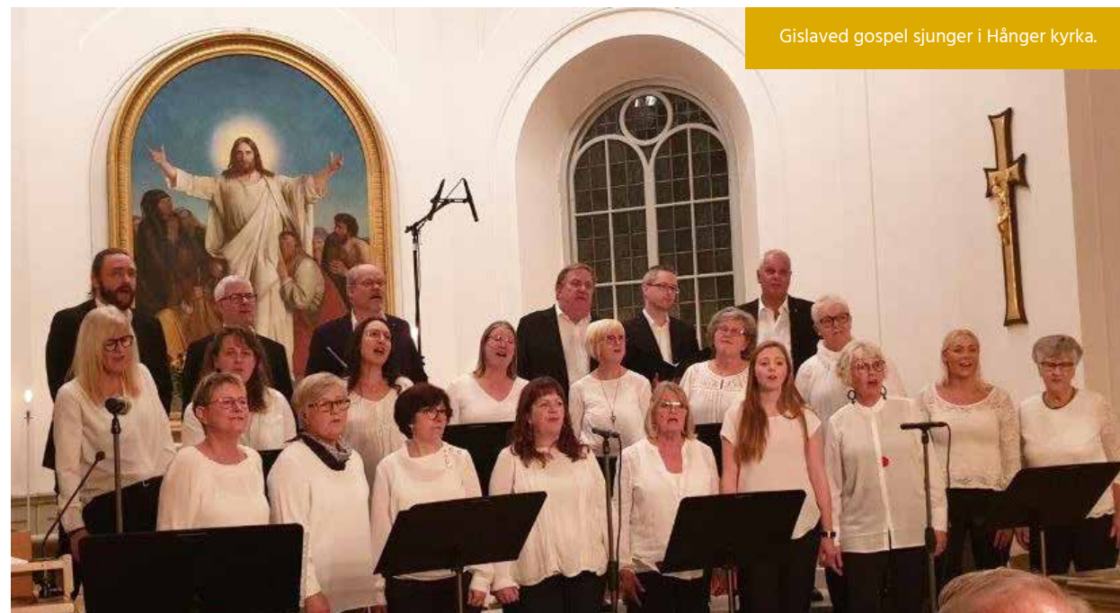
Gislaved gospel sjunger i Hånger kyrka.

/Röda korset, Forsheda missionsförsamling och Svenska kyrkan.