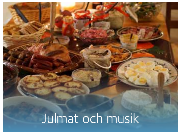
Julmat och musik

Lör 7 dec kl 10-12.30 i Älvsåkers församlingshem