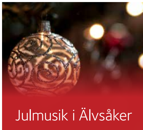
Julmusik i Älvsåker