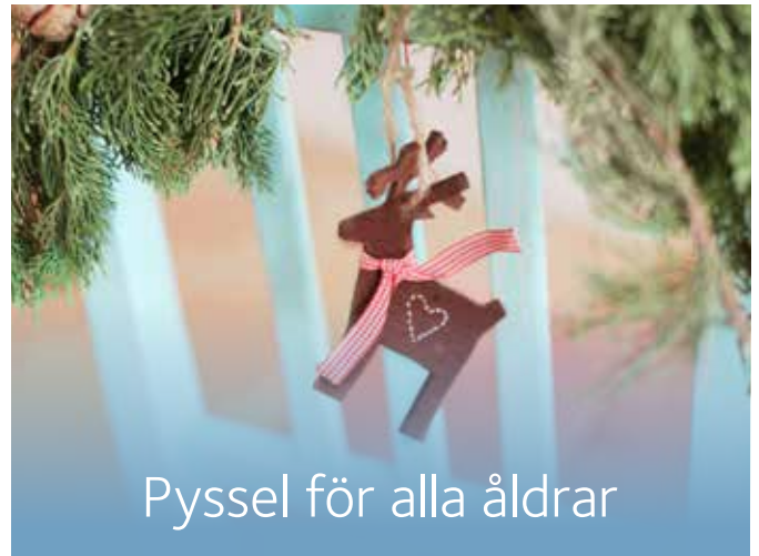
Pyssel för alla åldrar

JULPYSELKVÄLL. Adventsfika och pyssel i olika svårighetsgrad.