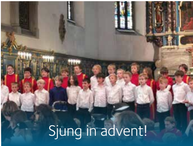
Sjung in advent!

ADVENTSKONSERT. Lyssna till de kända adventssångerna och sjung julens psalmer. Kungsbacka Gosskör och Tölö Vocalis under ledning av Leander Franke m fl.