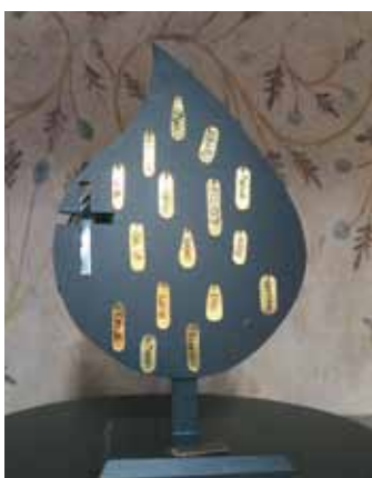
Dopträd i Tensta