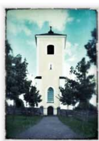
ÄNGLABYGDSMÄSSA LENA KYRKA