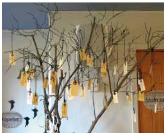
Dopträd i Storvreta

Dopdroppen. Smycket är en symbol för SKUT, Svenska kyrkan i utlandet, och påminner om att vi är en del av den världsvida kyrkan. Gudstjänsten blir en fest i ljusets och glädjens tecken och festen fortsätter sedan med tårtkalas för stora och små.