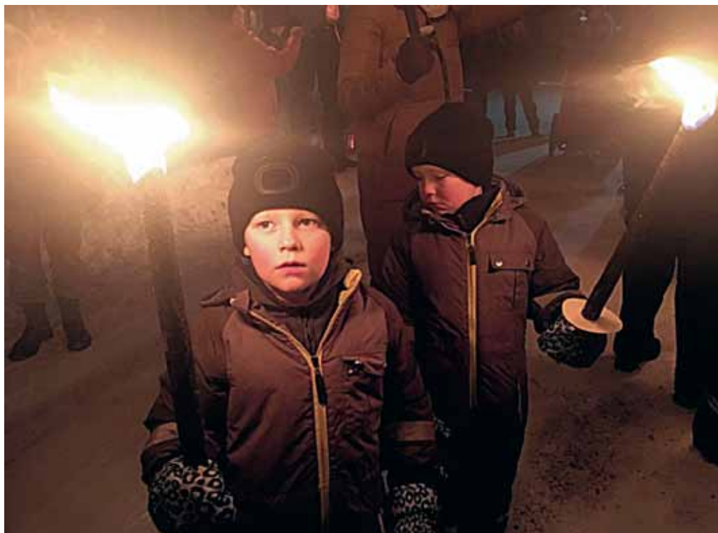
Två fackelbärare julnatten 2018.

6 jan 18.00 Sång och bön under stjärnan, Trekanten