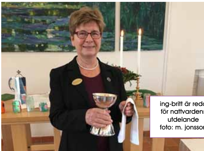
ing-britt är redo för nattvarens utdelande

En kyrkvärd hälsar välkommen, delar ut psalmböcker, läser ofta söndagens texter, hjälper till vid nattvarden och kollekten. En kyrkvärd kan också få uppdraget att ha ansvar över kyrkans inventarier.