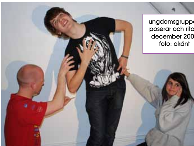
ungdomsgruppen poserar och ritar i december 2009