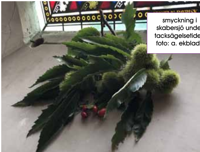
smyckning i skabersjö under tacksägelsestiden