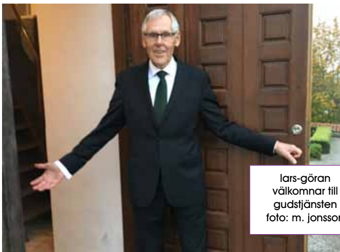
lars-göran välkomnar till gudstjänsten

När det ligger tvättopletter eller parkeringskvitton i kollektlåven! Vill man inte bidra, så kan man ju helt enkelt låta bli.