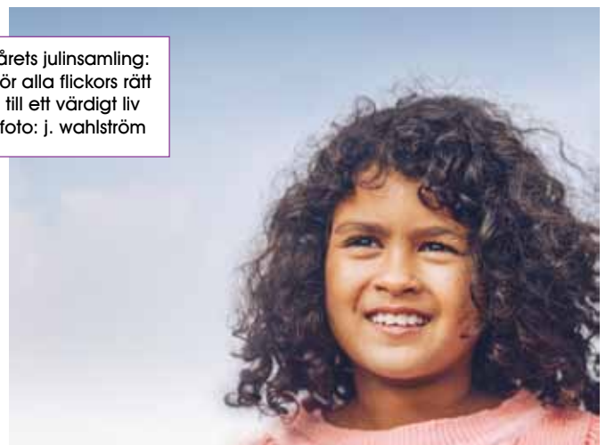
årets julinsamling: för alla flickors rätt till ett värdigt liv