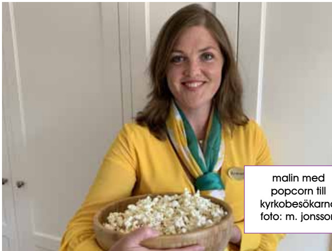
malin med popcorn till kyrkobesökarna

I kyrkoordningen läser vi att en kyrkvärd är en döpt person som har rösträtt i församlingen och som väljs av kyrkorådet för 4 år i taget. Uppdraget som kyrkvärd hör ihop med gudstjänsterna.