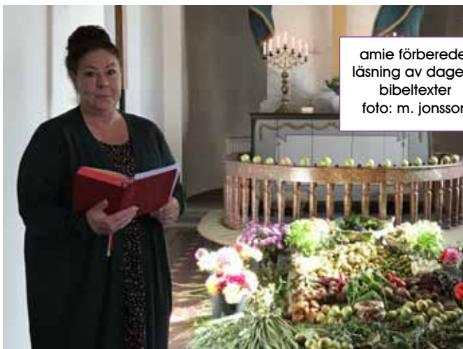
amie förbereder läsning av dagens bibeltexter