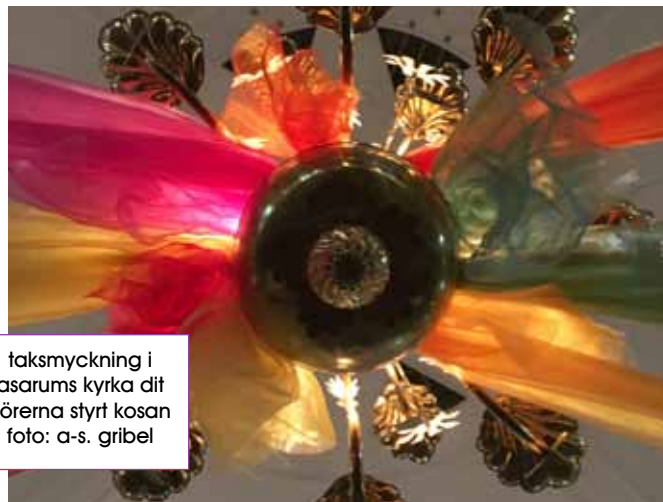
tacksmyckning i asarums kyrka dit körerna styrte kosan