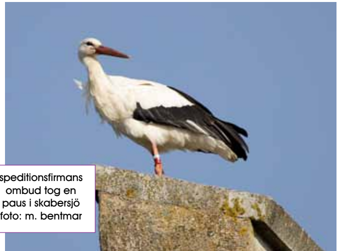
speditionsfirmans ombud tog en paus i skabersjö