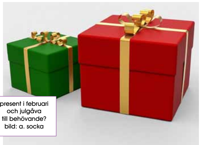
present i februari och julgåva till behövande?