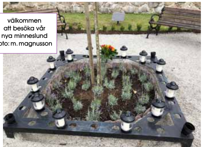
välkommen att besöka vår nya minneslund