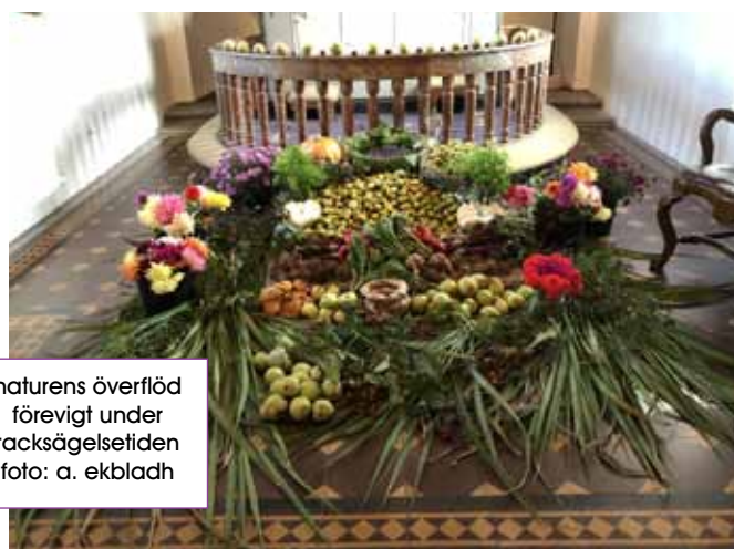
naturens överflöd förevigt under tacksägelsestiden