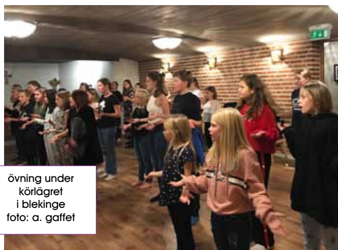
övning under körläget i blekinge