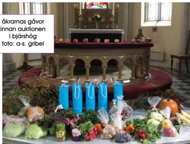
åkrarnas gåvor innan auktionen i bjärshög