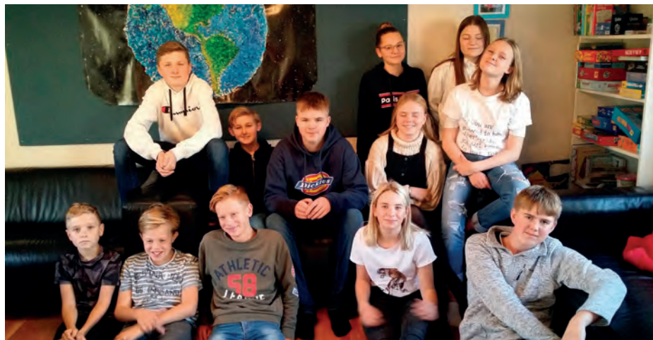
En blandning av ungdomar i Club 13 och ungdomsgruppen.