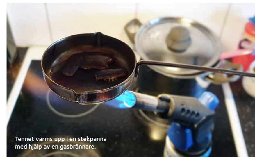
Tennet värms upp i en stekpanna med hjälp av en gasbrännare.

TEXT Ingrid Trulsson