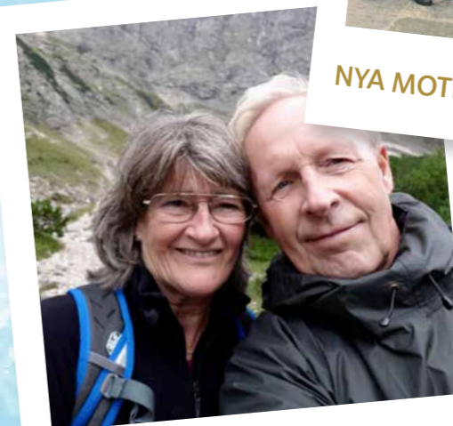
GEMENSKAPSTRÄFF 19 dec