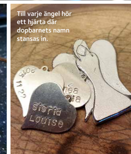
Till varje ängel hör ett hjärta där dopbarnets namn stansas in.