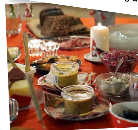
JULFEST 12 jan

Fuxerna församlingshem Sön 8 dec kl. 11.30-14 Mässa i Fuxerna kyrka kl. 10