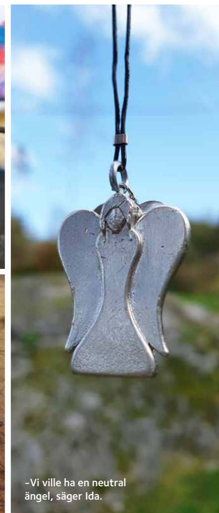
– Vi ville ha en neutral ängel, säger Ida.