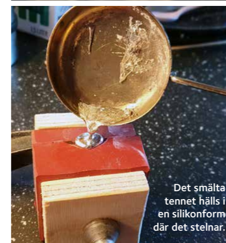
Det smälta tennet hålls i en silikonform där det stelnar.