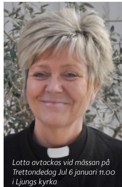
Lotta avtackas vid mässan på Trettondedag Jul 6 januari 11.00 i Ljungs kyrka

Vi önskar dig glädje och välsignelse i din nya tjänst som verksamhetschef i Uddevalla församling.