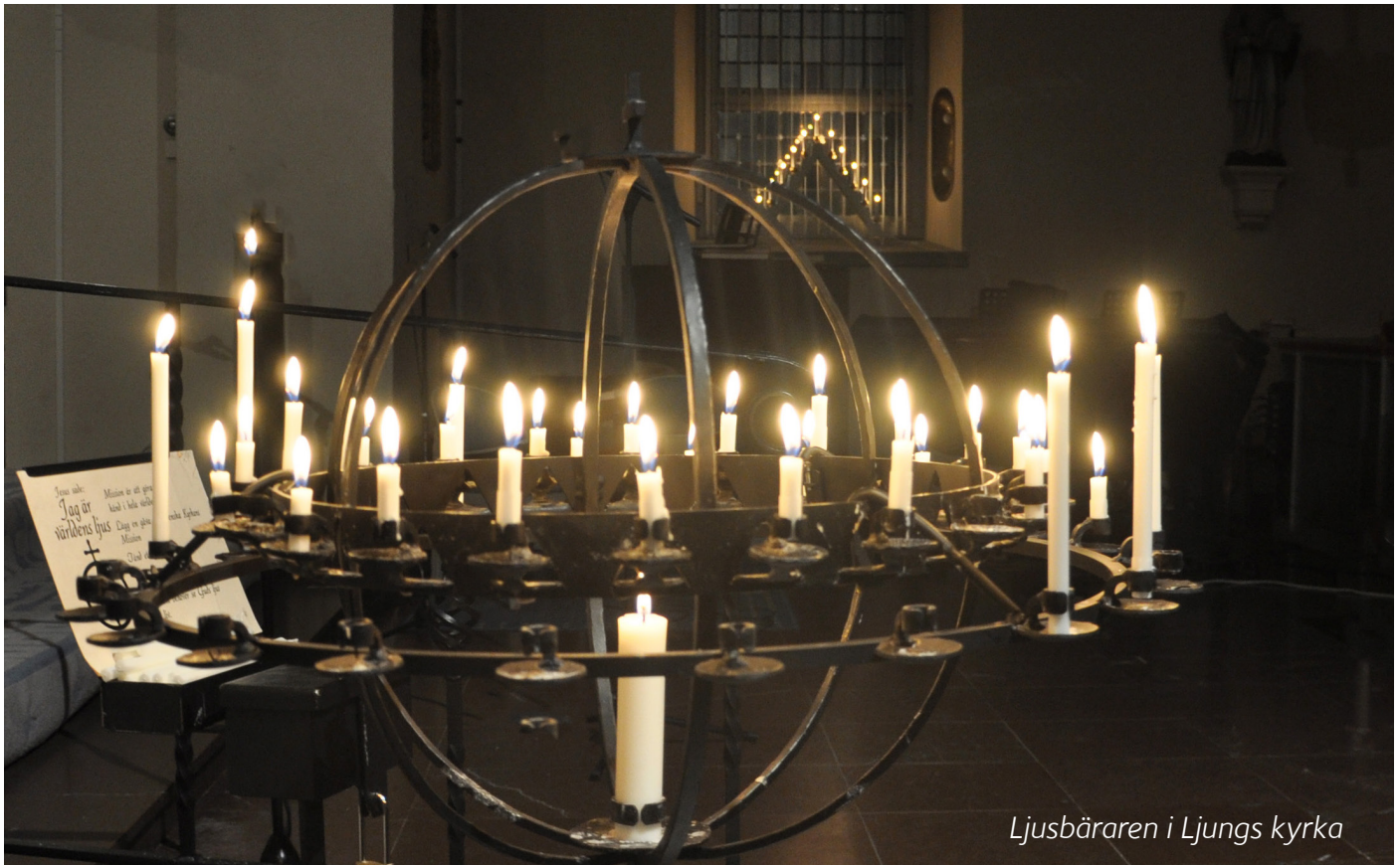
Ljusbäraren i Ljungs kyrka