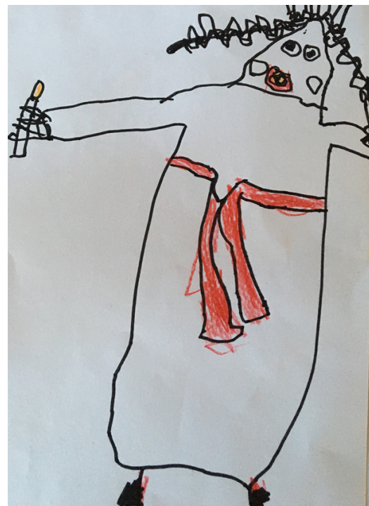
Nellie 5 år