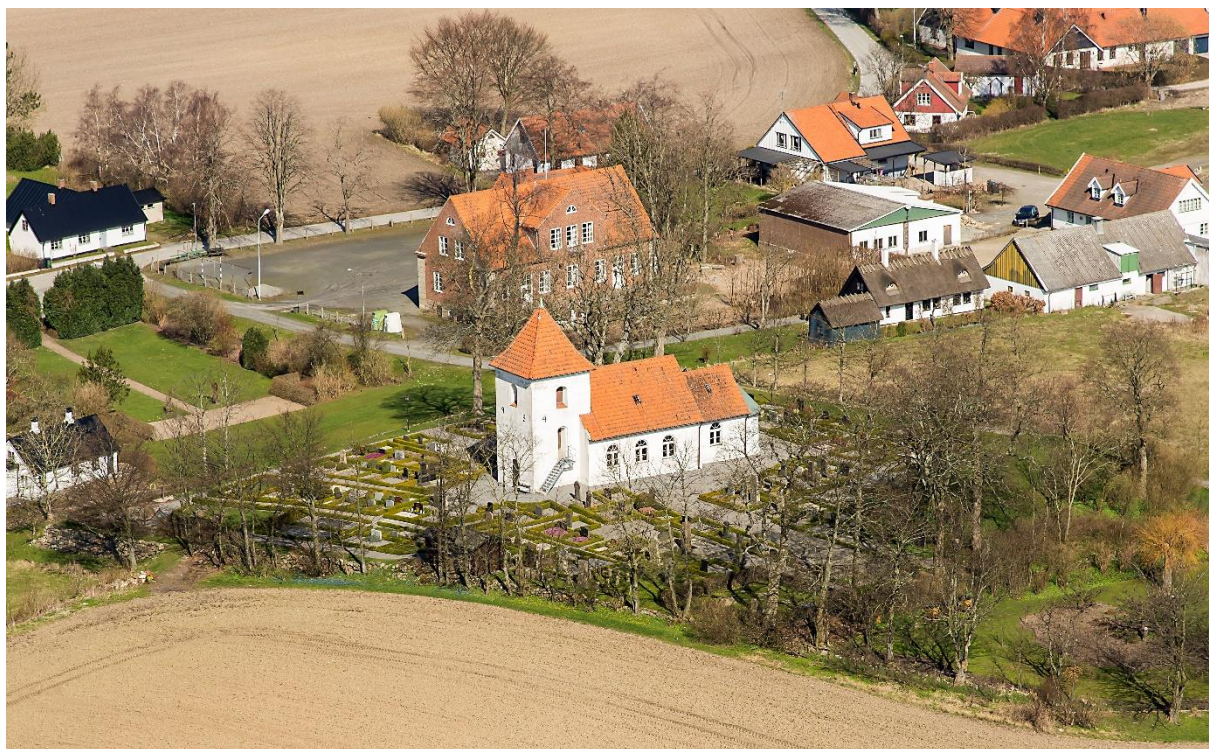
Flygbild över Snårestads kyrkomiljö från sydväst med skolbyggnaden från 1927 i bakgrunden.