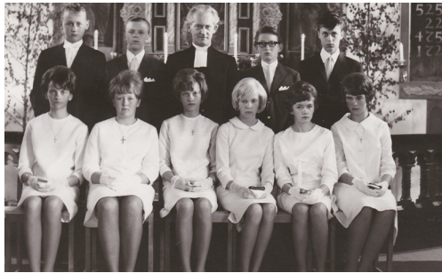
Konfirmation i Vessige kyrka år 1966.

-Jag minns träffarna med kompisarna. Prästen var eländig och tråkig. Under konfirmationen fick vi svara på frågor som ett förhör. Men jag var så nervös så jag fick en "black-out". Kompisen bredvid fick svara istället. Men jag blev konfirmerad ändå!