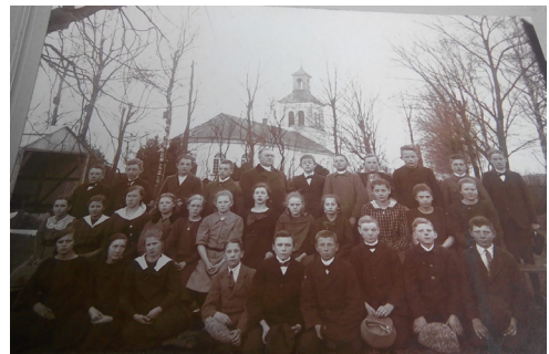
Konfirmationsbild tagen i Vessige Prästgård. Konfirmander födda 1908.

-Jag gick på lägerläsning under fyra veckor. Det var roligt och då var det ett äventyr bara att vara borta från familjen så länge. Det låg en sjö i närheten där vi badade och vi gjorde ofta samarbetslekar för att binda samman hela gruppen. Vi var 20 konfirmander och ca 10 ledare. Varje dag fick vi ett bibelord som vi skulle lära oss utantill. Detta kunde sitta lite var som helst på lägergården.