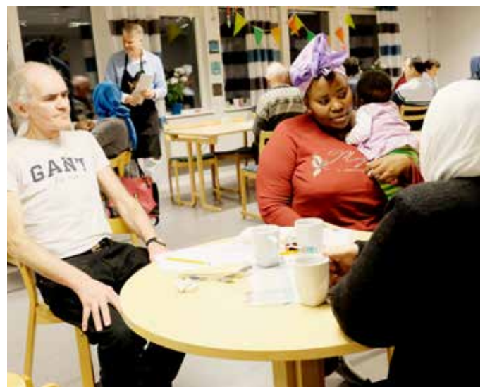
Fullt hus! På språkkaféet möts alla åldrar. Barnen leker och pysslar medan de vuxna hinner prata en stund över en kopp kaffe.