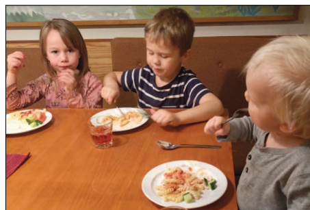
Efter lek, pyssel och lite andlig spis är det gott att få något i magen också.

De har minst sagt fullt upp att göra under tiden, och ordnar även med maten som serveras innan det är dags för avslutning.