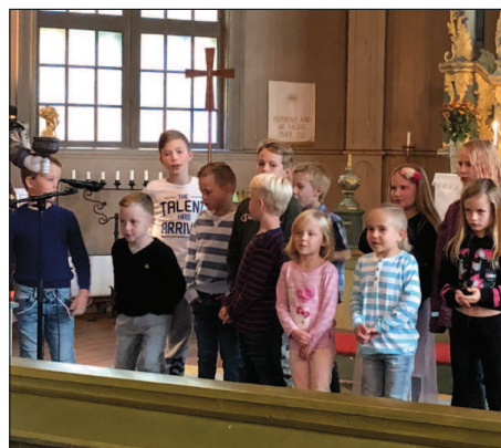
Ingen jul i kyrkorna utan julkonsert. Ovan kör och musiker på konserten i Filipstads kyrka som lockade stor publik. Till höger kyrkokörerna i Brattfors och Nordmark som sjöng i respektive kyrkor och Nordmarks barnkör Sångfåglarna.