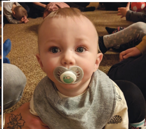
Barn och föräldrar har alla lika mysigt och kul vid träffarna i församlingshemmet. Tiger, åtta månader, är yngst bland deltagarna.