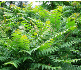
Gudaträd Ailanthus altissima