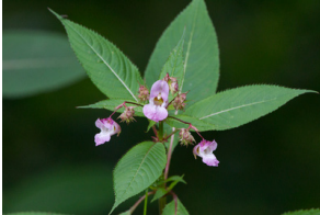
Jätte balsamin Impatiens glandulifera