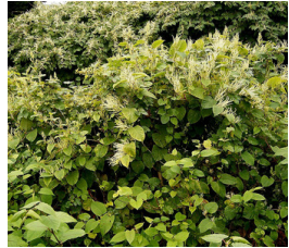
Parkslide * Reynoutria japonica