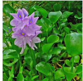
Vattenhyacint Eichhornia crassipes