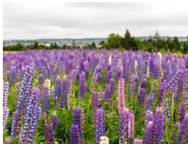
Blomsterlupin * Lupinus polyphyllus