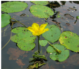
Sjögull * Nymphoides peltata