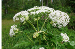
Jätteleka Heracleum mantegazzianum