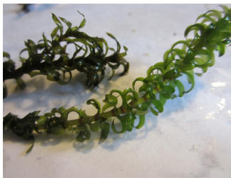
Smal vattenpest Elodea nuttallii