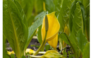
Gul skunkkalla Lysichiton americanus