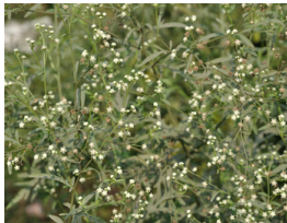
Flikpartenium Parthenium hysterophorus