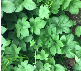
Japansk humle Humulus japonicus