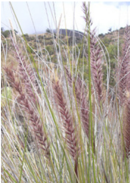
Fjäderborstgräs Cenchrus setaceus