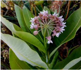
Sidenört Asclepias syriaca