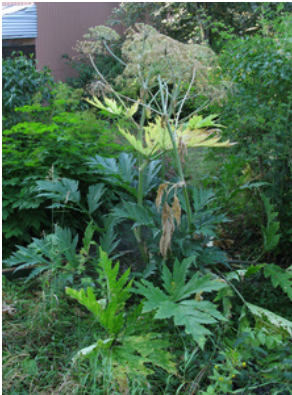
Tromsöloka Heracleum persicum