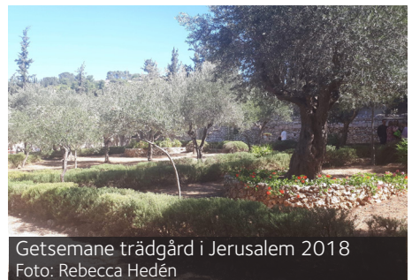
Getsemane trädgård i Jerusalem 2018

Jesus äter för sista gången tillsammans med sina tolv lärjungar och Jesus säger till dem att de ska fortsätta att bryta bröd och dricka vin tillsammans även när han inte finns ibland dem. Gör det till minne av mig, säger Jesus. Den här kvällen är förebilden för kyrkor i hela världen varje gång de firar nattvard med bröd och vin. Senare på natten, när Jesus och hans lärjungar har samlats i Getsemane trädgård, greps Jesus av de romerska soldaterna. Det är en av lärjungarna, Judas, som förråder Jesus. Han får 30 silvermynt för att avslöja vem Jesus är.