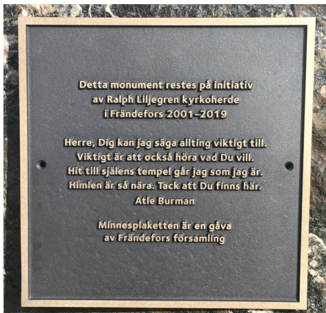
Text på tavla som finns på en av stenarna.

Detta stenmonument kom till efter en ide av Ralph Liljegren. Det återfinns på den nya delen av kyrkogården bland björkarna invid gångvägen som leder till Ringaregatan. Stenarna grävdes upp när man skulle dränera för den nya delen av kyrkogården.