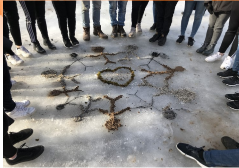
Naturskulptur utav konfirmander år 18/19. Den symboliserar församling och gemenskap.