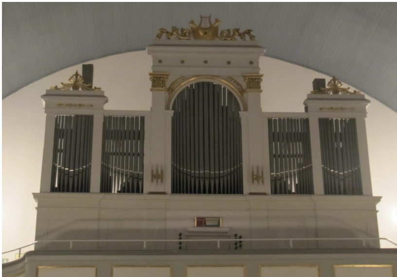
Orgeln som vände hem.