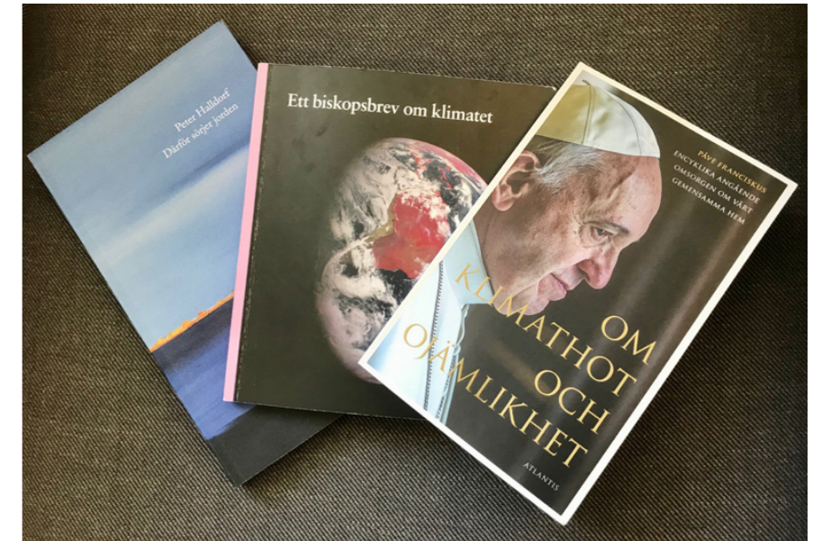
På hemsidan finns recensioner av tre kristna böcker om det miljöhot som hänger över världen. Gå gärna in och läs: www.svenskakyrkan.se/lillaedet

inte saknat det heller. Istället försöker jag promenera mycket, vilket är bra för hälsan, men jag åker även kollektivt.