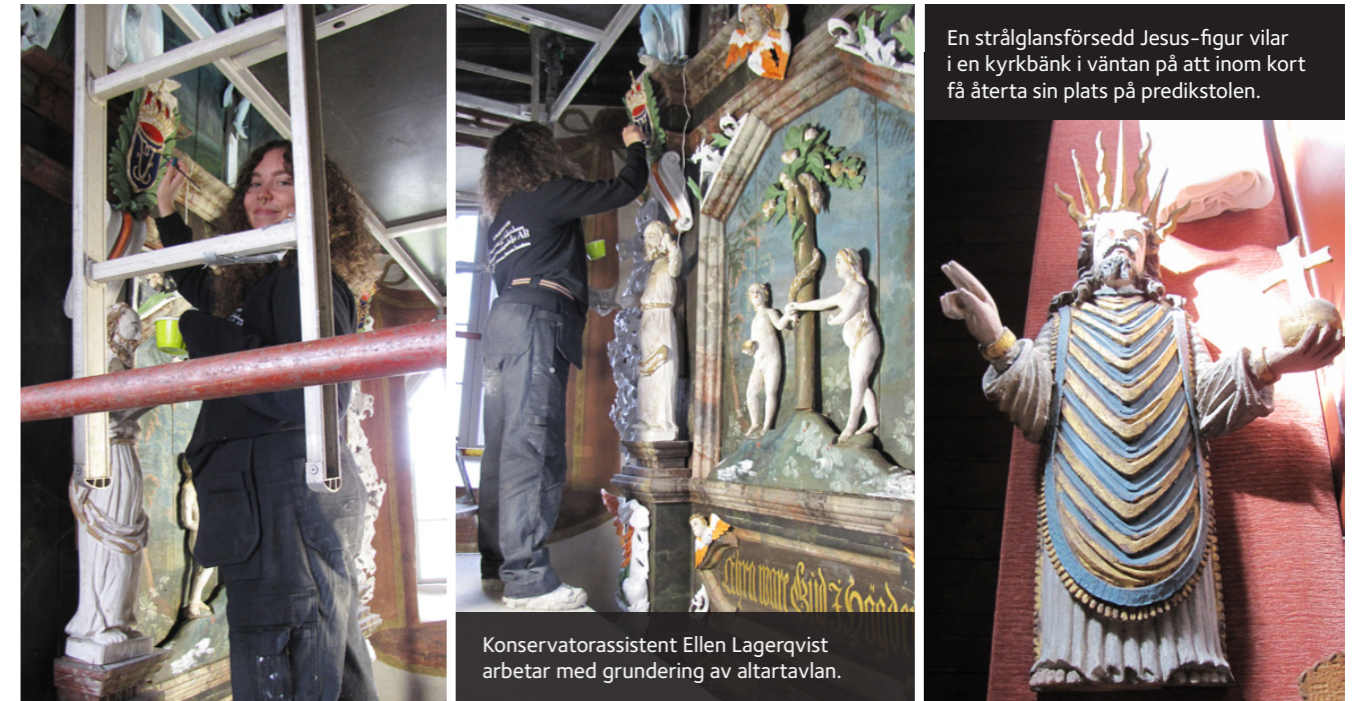
En strålgångsförsedd Jesus-figur vilar i en kyrkbänk i väntan på att inom kort få återta sin plats på predikstolen.