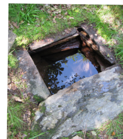
ST OLOFS KÄLLA 29 juli