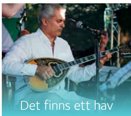
Det finns ett hav

18 JUNI • Ars Veritas. Denna sommarkväll kommer ensemblen Ars Veritas att sjunga musik från medeltid, renässans och 1900-tal. Musik av tonsättare som bland andra Poulenc, Josquin och Gregorianik.