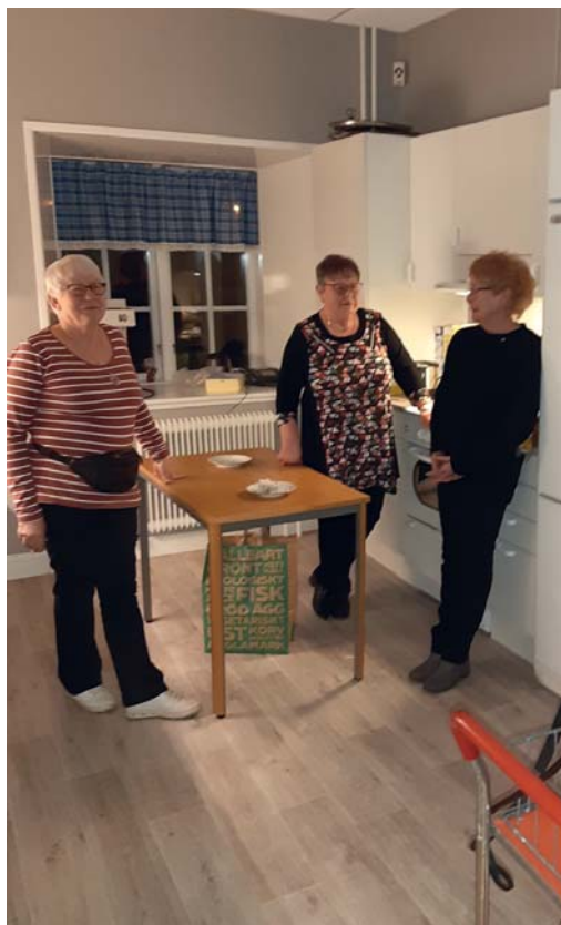
Några av Nykroppadamerna som svarade för fikaserveringen under kvällen i sockenstugan.