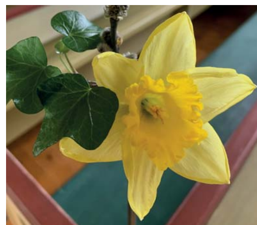
Ljus och liljor, som hör påsken till. Till vänster det utsmyckade altaret i Skavnäsets kapell.