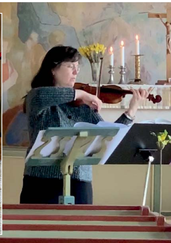
Levande ljus och levande musik i Gåsborns kyrka.