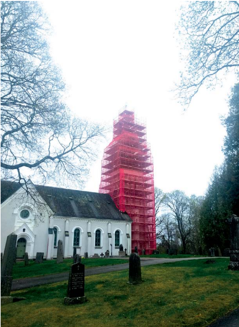
Kyrktornet i Nykroppa har fått ett något annorlunda utseende på sista stegen, i och med den igångsatta renoveringen. Arbetet beräknas pågå hela sommaren.