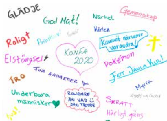
Konfirmandernas sammanfattning av lägret!