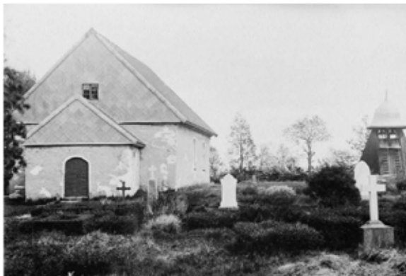
Bild över kyrkogården vid 1800-talets slut. Här syns flera äldre gravstenar och häckar av buxbom.

Fram till mitten av 1800-talet tillverkades gravstenar hantverksmässigt av stenhugare. Stenvårdarna från denna tidsperiod har ett relativt likriktat formspråk. Stenarna är tunna och sparsamt dekorerade och ofta av mjukare bergarter som kalksten eller sandsten. Bågformig avslutning i övre del är vanligt, ibland krönt av spetsar. En vanlig inskription på gravstenar från den här tiden är bokstäverna IHS vilka är en förkortning av Jesus. En annan vanlig dekoration är timglaset, vilket ska påminna om att döden kommer till alla.