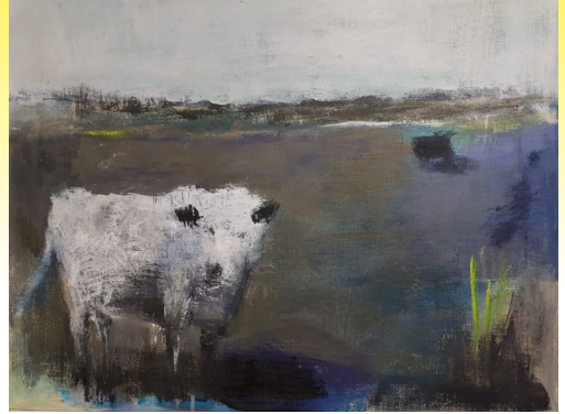
Tavla från konstutställningen.