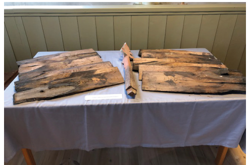
Lite av pärttaket.