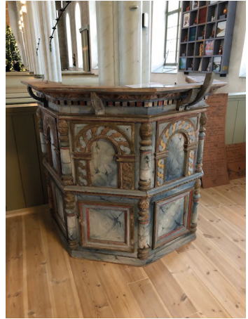
En del av predikstolen.

Öppet vid gudstjänsterna samt kl. 12-16 under delar av Oreveckan, v. 28 (6, 8-10/7). Annan tid, boka tid via receptionen, tel: 0248-736 50.