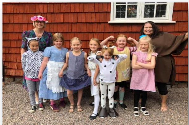
Björstätters barnkör firade Astrid Lindgren-gudstjänst den 26 maj