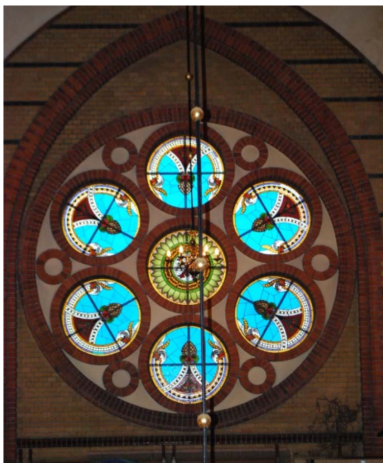
[4]: Fönster i korsarmen

gjutjärnsbågar. De spetsbågiga fönstren i mitt- och sidoskepp har blyinfattade, färgade katedralglas i rombmönster omgivet av tunna bårder, medan glasen i klerestoriets trepassfönster är smyckade med vegetativa dekorer. Rutorna i korsarmarnas rundfönster [4] är av färgat glas i form av olika religiösa symboler; heraldiska liljor (Treenigheten), en duva (Den helige ande) och tecknen A \Omega (alfa och omega, början och slutet). Korets fönster pryds av figurativa glasmålningar [5], som utformats av konstnären Reinhold Callmander. De visar olika motiv i Nya Testamentet, såsom Betlehem, Bergspredikan, Kristus i Getsemane och evangelisterna med sina respektive symboler.