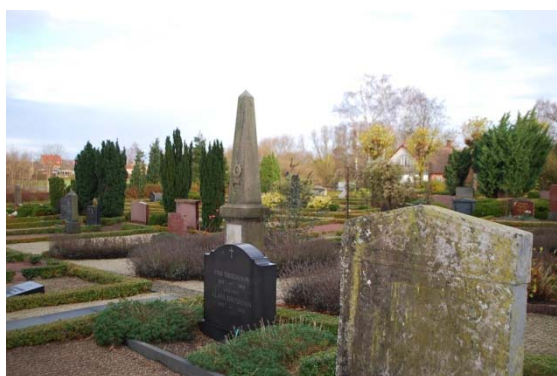
[8]: Äldre kyrkogården, i fonden skånsk kalkstensvård

I ett av de norra kvarteren märks en avdelning för linjegravar [9], det s.k. ”allmänna varvet”, en gravordning som var i bruk fram till 1968 för människor som inte hade råd att köpa sig en gravplats. Ytan är gräsbeväxt med två rader av gravplatser. Längs den bakre buxbomskanten finns en rad med enkla minnesplattor av tegelliknande material. Framför dessa finns två liggande stenar. Allmänningen ligger norr om kyrkan, medan de mer påkostade, äldre gravarna generellt återfinns på kyrkans södra sida. Ett noterbart undantag från detta är den prästgrav, som ligger i kyrkans nordvästra hörn.