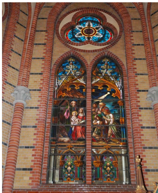
[5]: Fönster i koret

Den lilla sakristian ligger sex steg lägre än koret. Golvet är av terrazzo, väggarna är putsade och målade i vitt med modern färg, och taket är täckt av ett putsat stjärnvalv med tegelribbor. Mot öster finns ett beredningsaltare framför fönstret, som försetts med en glasmålning av Hugo Gehlin från 1934, som föreställer Fadern, Sonen och den Helige Ande. Åt öster finns en utgång till kyrkogården.