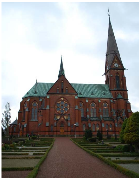
[1]: Fasad mot norr

fasad, sidoskepp och de båda korsarmarnas gavlar, är något utskjutna från fasaderna. Granittrappor leder till alla dörrarna, och till huvudentrén i väster även en relativt brant ramp. Ovan entréerna mot norr och söder finns prydnadsgavlar, s.k. vimperger, flankerade av strävpelare krönte av små fialer med torntak. I de triangulära gavelröstena finns cirkulära- eller trepassformade blinderingar. Dörrarna sitter i spetsbågiga portaler med flersprångiga omfattningar, där valven murats i omväxlande rött och svart tegel. Över ekdörrarna, som har kvar sin originalbeslagning med smidda, svartmålade bockhornsgångjärn, finns tympanonfält dekorerade med bl.a. kors. Huvudentrén genom tornet [2] har en likartad utformning med dörrpartiet omgivet av en spetsbågig, flersprångig omfattning. Valvbågarna bärs upp av gjutna, korintiska halvkolonner. Ovanför den korgbågiga dörren finns ett spetsbågigt överljus, där en cirkelformad spröjs skrivits in. Glasen i cirkeln bildar ett fyrpass. Vimpergen kröns av en minnesplatta, som förkunnar att kyrkan är byggd under Oscar II.