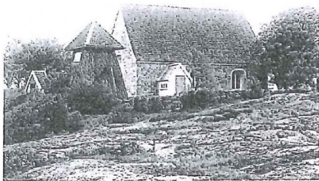
Fullestad kyrka efter renoveringen 1909-1913.

Ritning över renoveringen skickades till Kungl Överintendentämbetet för godkännande. Arkitekten Torben Grut besökte kyrkan och fann den gamla läktaren alldeles förträfflig och helt onödigt att bygga en ny. Den "med utmärkta, rustika målningar i rött, grönt, brunt och grått, med stående figurer och namn i fyllningarna" utsmyckade läktaren fick därmed vara kvar.