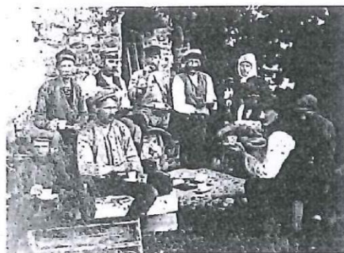
Arbetet krävde påfyllning av energi

Pastoratets kyrkostämma "ansåg sig ej böra avslå den framställda begäran då Fullestads församling vore villig att underkasta sig så avsevärda utgifter som voro förenade med renovering av den gamla kyrkan och därmed visade sitt livliga intresse för en god sak" .