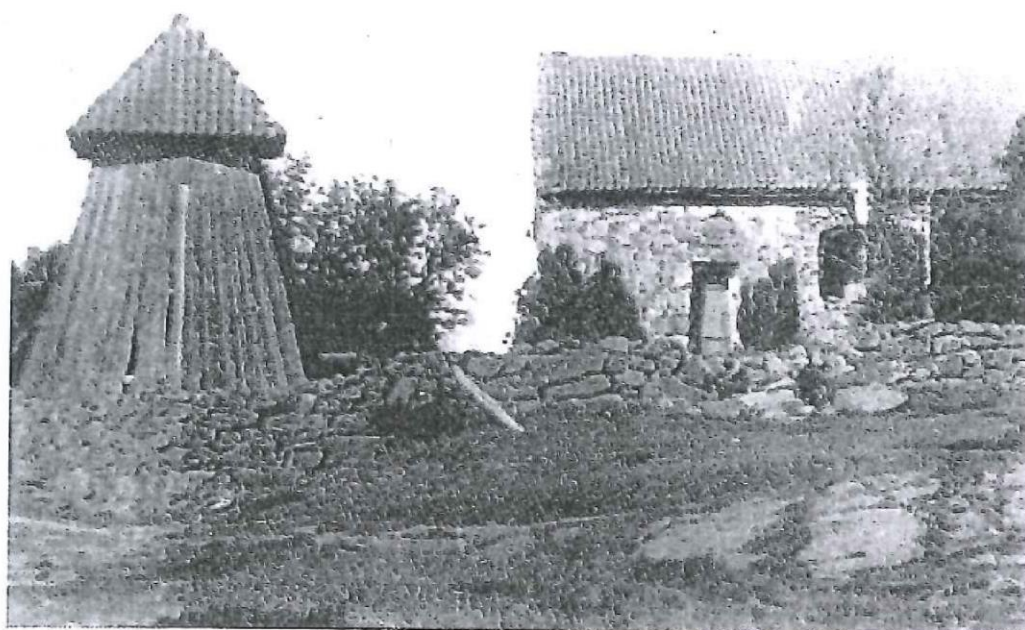
Troligen det äldsta fotot på Fullestad kyrka, taget innan renoveringen 1909-1913.

Kyrkdörren i södra väggen har en något primitiv konstruktion. Den saknar valv och avslutas upptill med en stenbjälke. Tidigare smalnade dörröppningen av upptill.