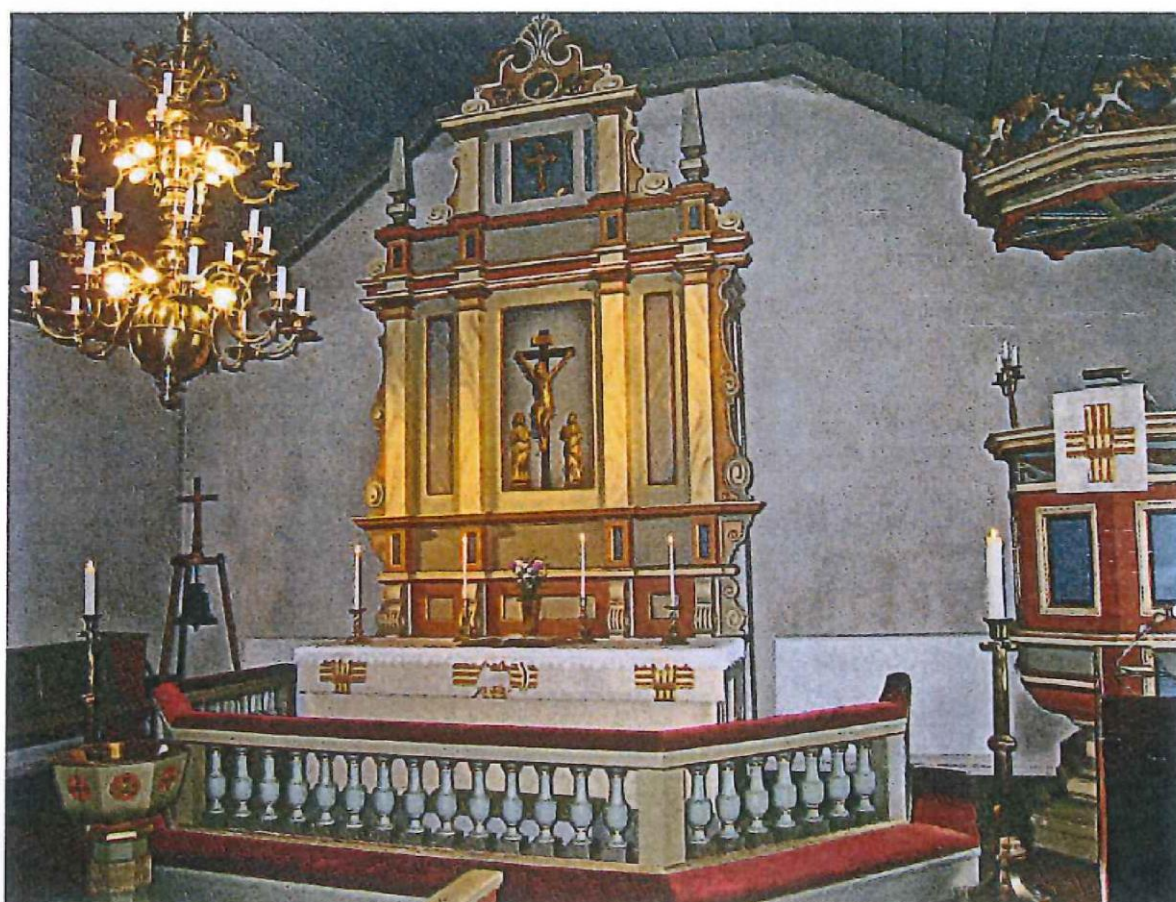
Interiör av Fullestad kyrka 2013.

Det nya seklet har medfört en del förändringar inom kyrkan. Största förändringen var den nya pastoratsindelning som genomfördes 2002. Resultatet av den blev att Fullestad sedan dess tillhör Lena församling som ingår i Vårgårda pastorat. I pastoratet tjänstgör en kyrkoherde och för varje församling en församlingspräst.