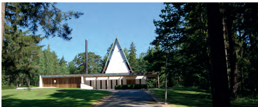
Silverdalskapellet i Sollentuna invigdes 1969. I källarplanet ryms ett krematorium med två ugnar. År 2016 kremerades i Sverige nästan åtta av tio avlidna.

Givetvis insåg förkämparna för kremerationens införande att behovet av mark för gravsättning skulle minska, men att denna begängelsemetod skulle påverka arkitekturen och karaktären på nya begravningsplatser blev en oanad konsekvens. För en urngravplats gällde – och gäller alltjämt – samma rättigheter och skyldigheter avseende gravrätten som för en kistgravplats. Urngravplatsen är dock betydligt mindre till ytan och gravanordningen blir därför mer måttfull och bättre anpassad till den nya skalan.