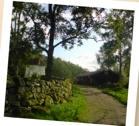
PILGRIMSVANDRING 5 sep