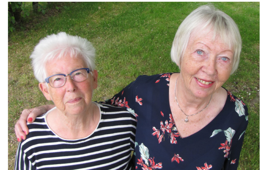
Vänskapen började redan på 70-talet