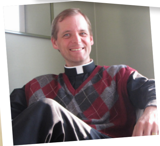
GEMENSKAPSTRÄFF 10 sep