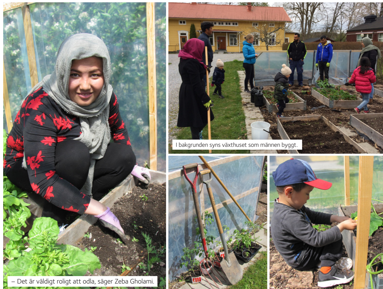
I bakgrunden syns växthuset som männen byggt.