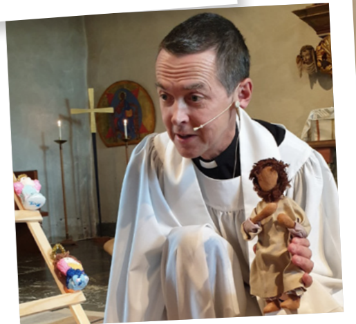
MESSY SUNDAY 27 sep