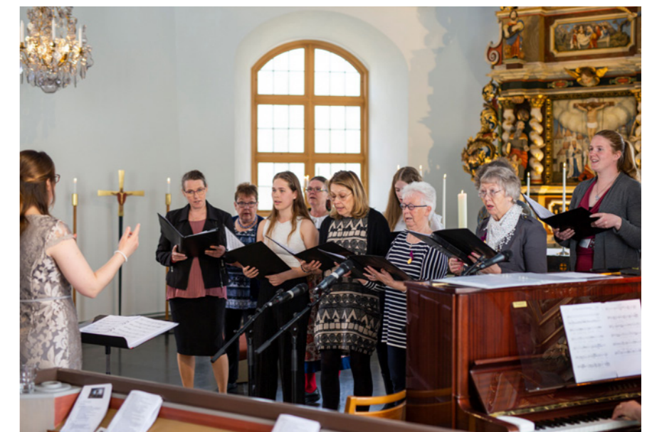
Båda sjunger i Hjärtum-Västerlanda kyrkokör