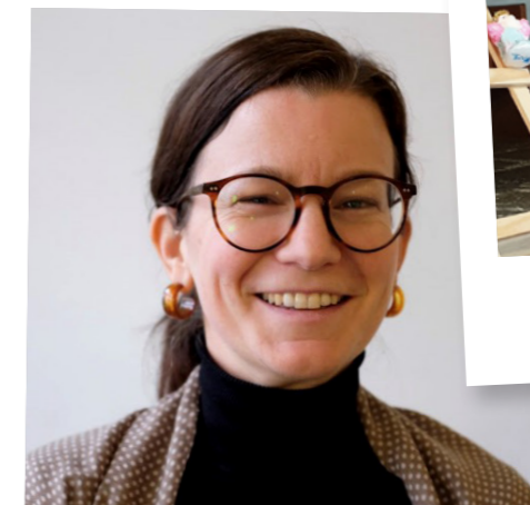
SÖNDAG+ 11 okt