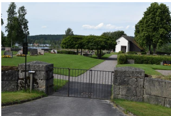
Övre kyrkogårdens östra entré.