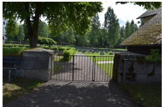
Övre kyrkogårdens västra entré.