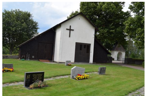
Gravkapellet från 1955.