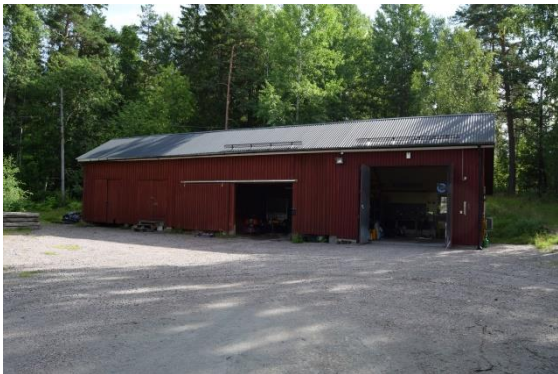
Garaget härrör från 1930-1950-talet.

Belysning finns i anslutning till kyrkans entréer samt vid minneslundan.