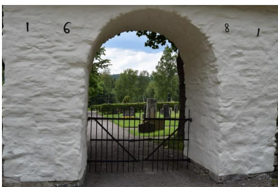
Stigporten är försedd med en smidesgrind.