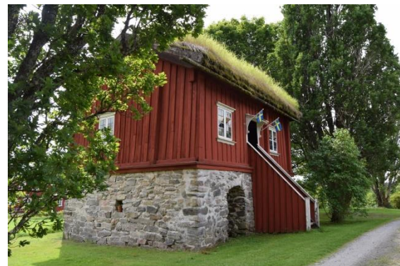
Karl XII-stugan uppförd 1715 och flyttad till nuvarande plats 1739.