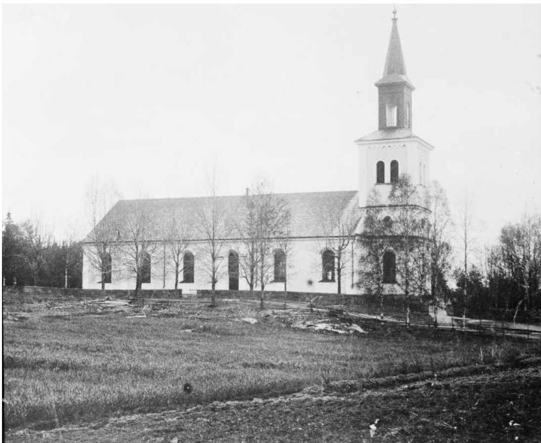
Holmedals nuvarande kyrka från 1857 sedd från nordväst, okänt år.