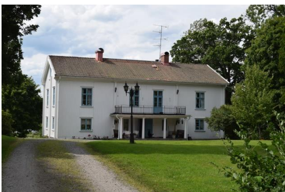
Holmedals prästgård uppfördes 1806.