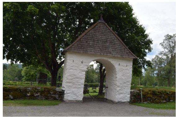
Stigport från 1681 (eller ev. 1618), gamla kyrkogårdens entré i öster.