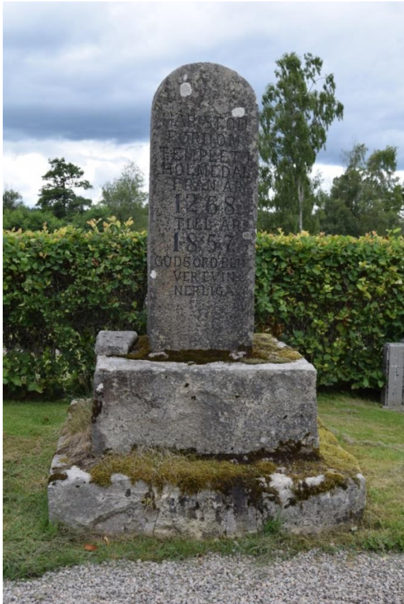
På gamla kyrkogården, i kvarter 1, står en minnessten över den tidigare kyrkan. Inskriptionen lyder; "Här stod fordom templet i Holmedal från år 1268 till år 1857 Guds ord blifver evinnerliga".