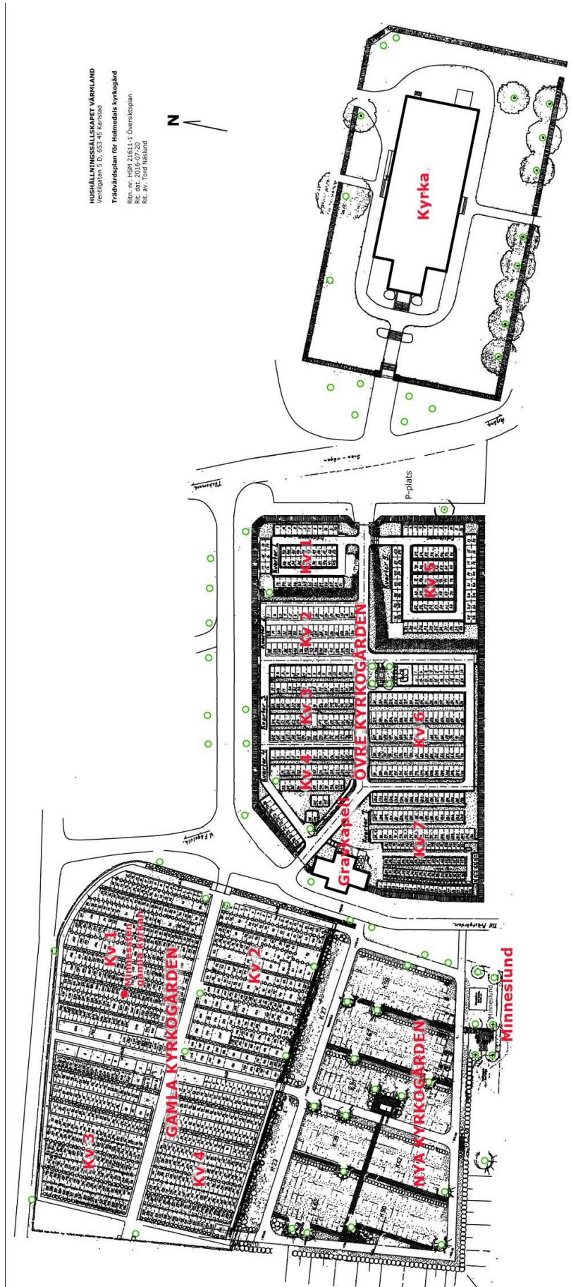
Ritning gjord av Hushållningssällskapet i Värmland. Tillägg med röd text har gjorts i efterhand av Carina Libeck.