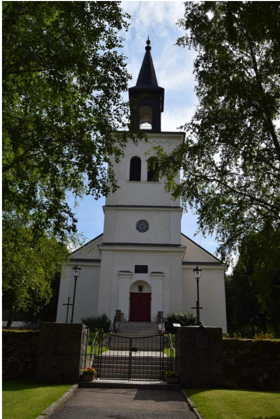
Kyrkan invigdes 1857. Huvudentrén finns i väster.