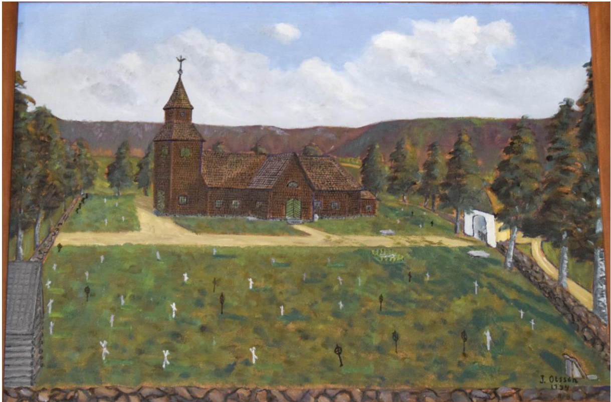
Målning av Holmedals gamla kyrka och kyrkogård sedd från söder. Målningen är gjord av J. Olsson 1934 utifrån uppgifter från gamla sockenbor. Tavlan finns i Holmedals kyrka.