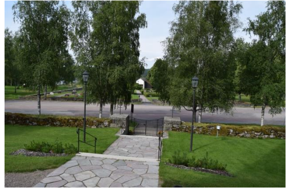
En viktig siktlinje finns mellan kyrkan och gravkapellet. Här syns trapporna och skiffergången till kyrkans port i väster.