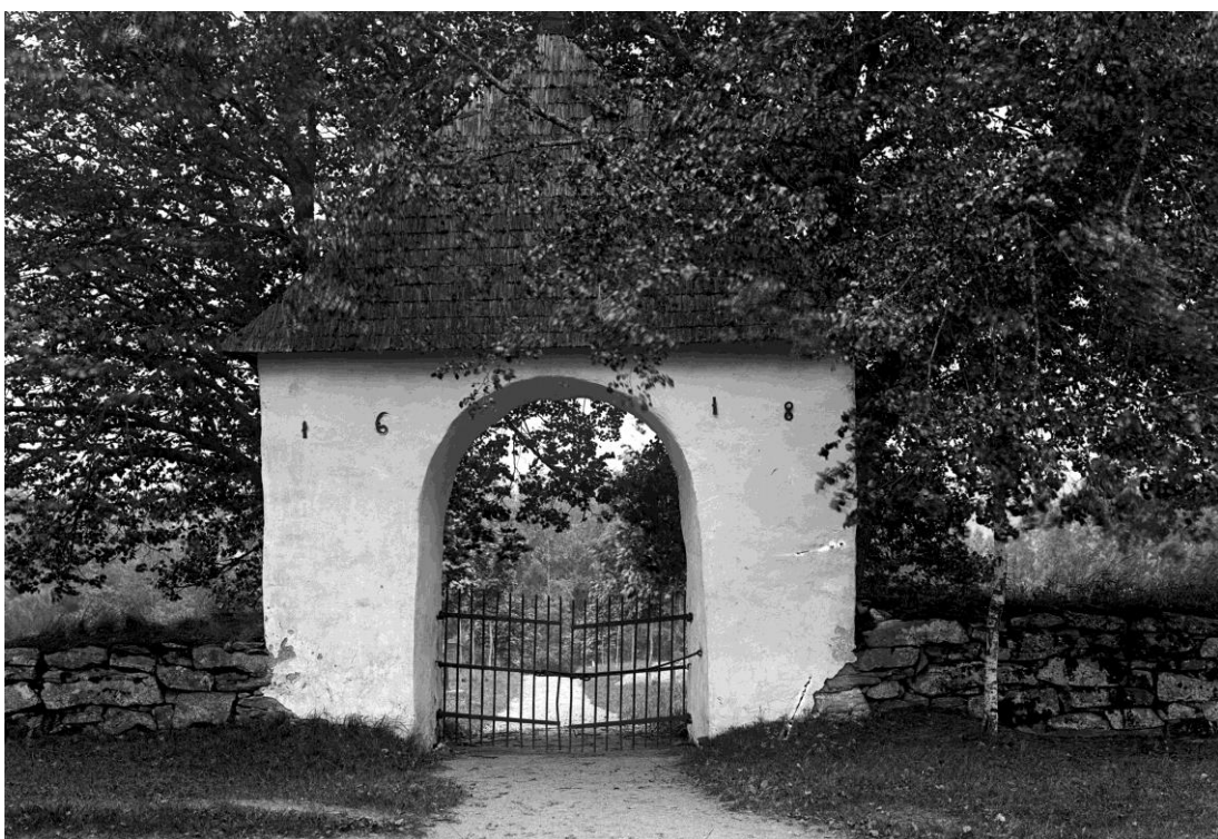
Stigporten i gamla kyrkogårdens östra mur. På detta foto bildar siffrorna av smide på fasaden årtalet 1618. I dag har siffrorna bytt plats och årtalet 1681 anges. Det råder osäkerhet om vilket som är det rätta årtalet.