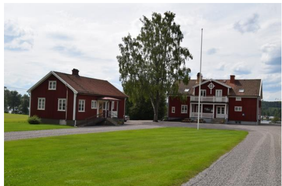
Förvaltningsbyggnaden t.v. och församlingshemmet t.h. är från 1930-talet.