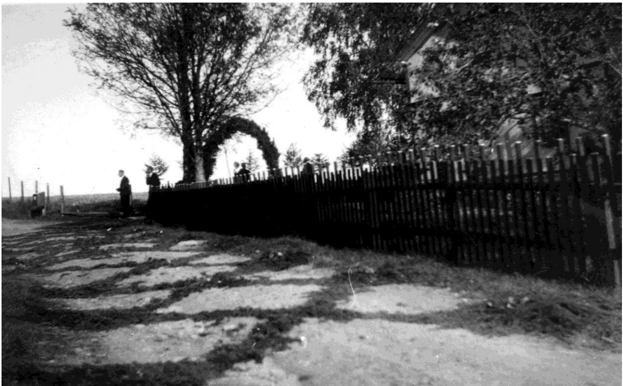
Smyckad landsväg, s.k. baring , sommaren 1937.