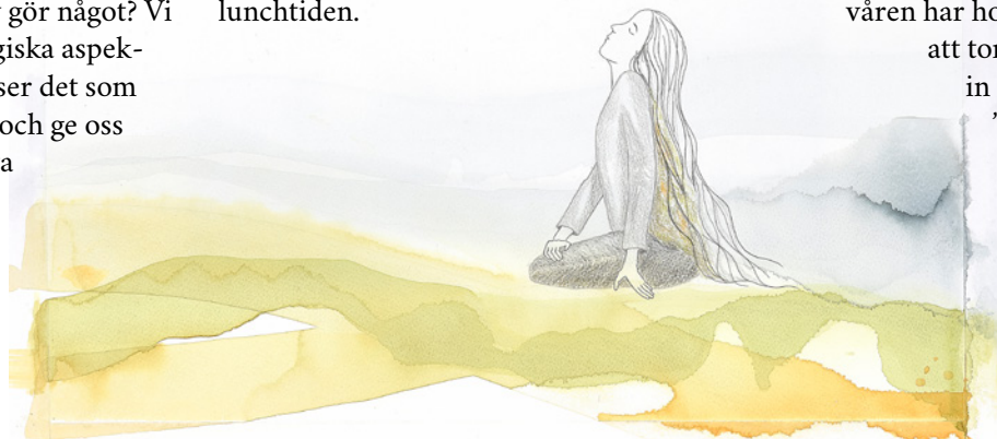
FOTOGRAF AV AKVARELLERNA: JOHAN LINDQVIST