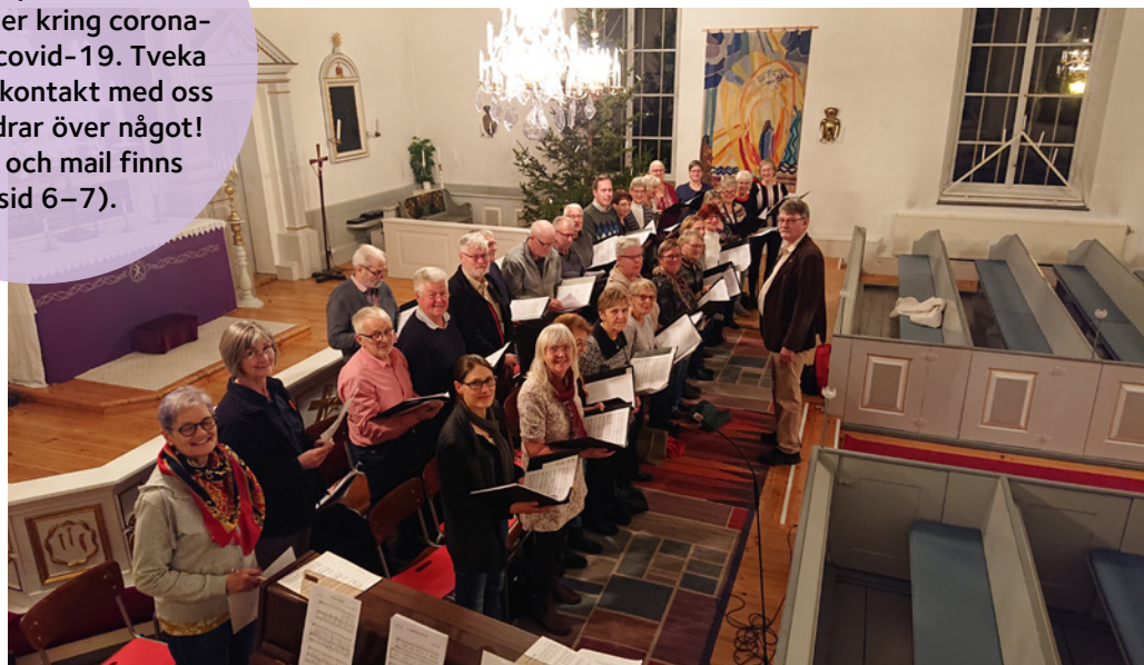
Övning inför förra årets gemensamma julkonsert med Hässleby-Kråkshults och Ingatorp-Bellös kyrkokörer.

Våra verksamheter och grupper påverkas av restriktioner kring corona- virus och covid-19. Tveka inte att ta kontakt med oss om du undrar över något! (telefon och mail finns på sid 6–7).