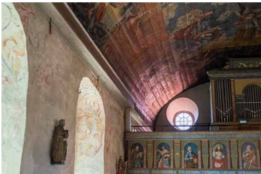
Rengjorda väggar och ny ljussättning ska bidra till ljus och rymd i kyrkan.

TEXT: CECILIA SUNDSTRÖM