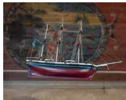
Votivskepp och takmålningar från 1700-talet är ett par av sevärdheterna i medeltidskyrkan.