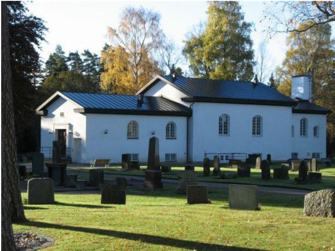
Kapellkrematoriet i Vetlanda (Uppståndelsekapellet) uppfört 1936