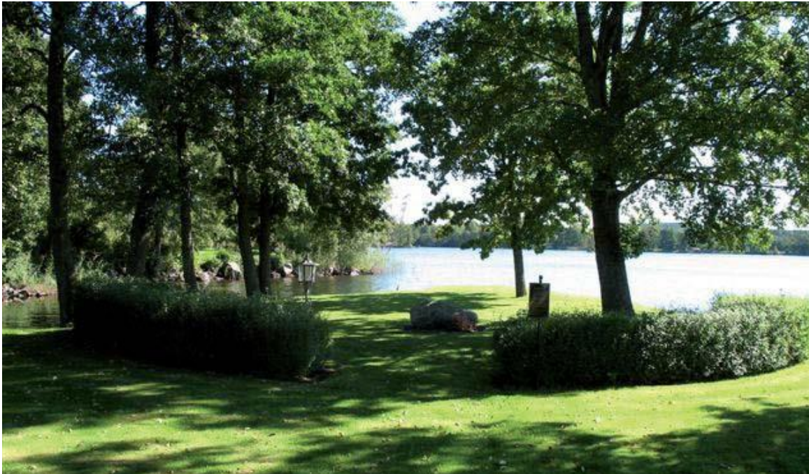
Minneslunden i Ramkvilla anlagd 2004 på en udde i sydöst