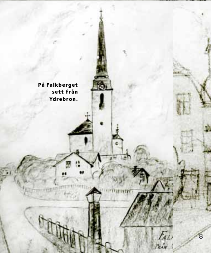
På Falkberget sett från Ydrebron.

Vi planerar för jubileumsmässan under förutsättning att den kan genomföras i enlighet med Folkhälsomyndighetens rekommendationer. Vi återkommer med mer info under hösten.