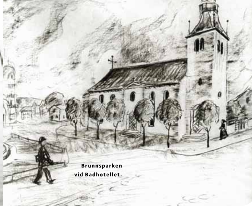
Brunnsparken vid Badhotellet.