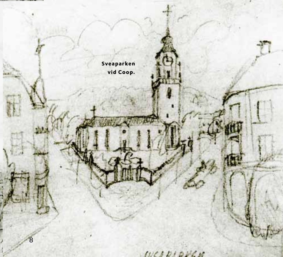
Sveaparken vid Coop.