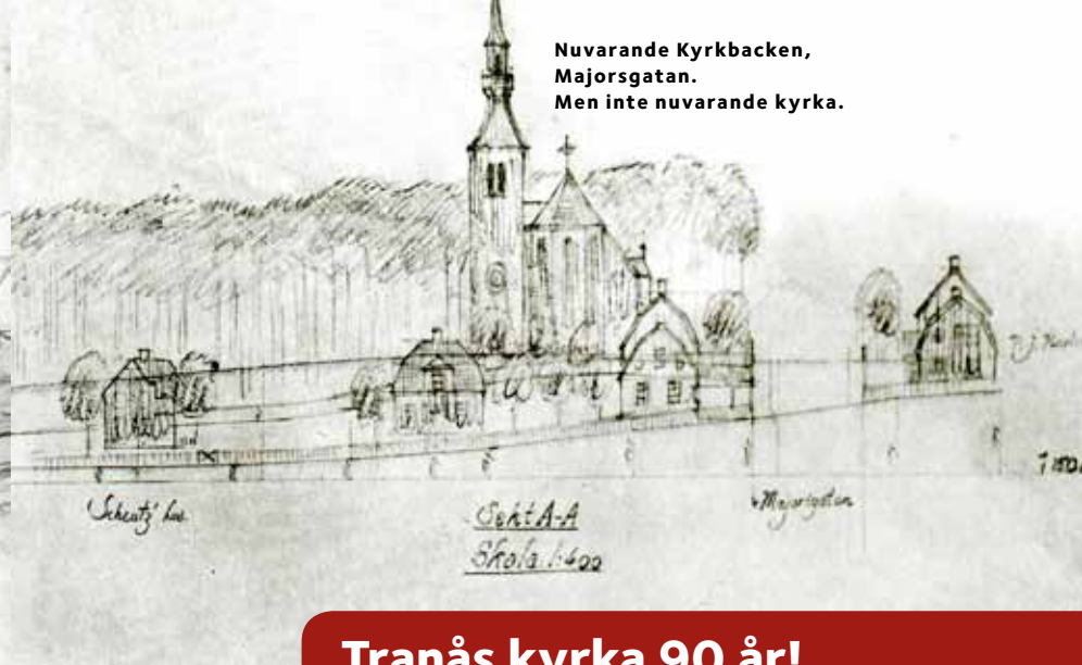
Nuvarande Kyrkbacken, Majorsgatan. Men inte nuvarande kyrka.