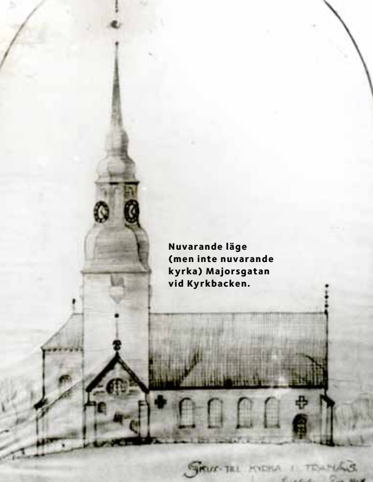
Nuvarande läge (men inte nuvarande kyrka) Majorsgatan vid Kyrkbacken.