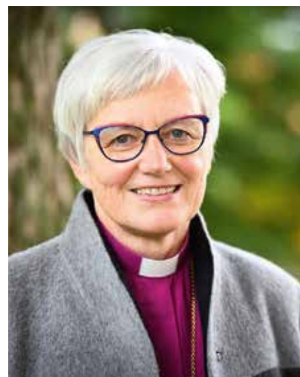
Ärkebiskop Antje Jackelén.

Ärkebiskopen har ibland anklagats för att vara ”politiserad” och att inte stå upp för klassisk kristen tro.