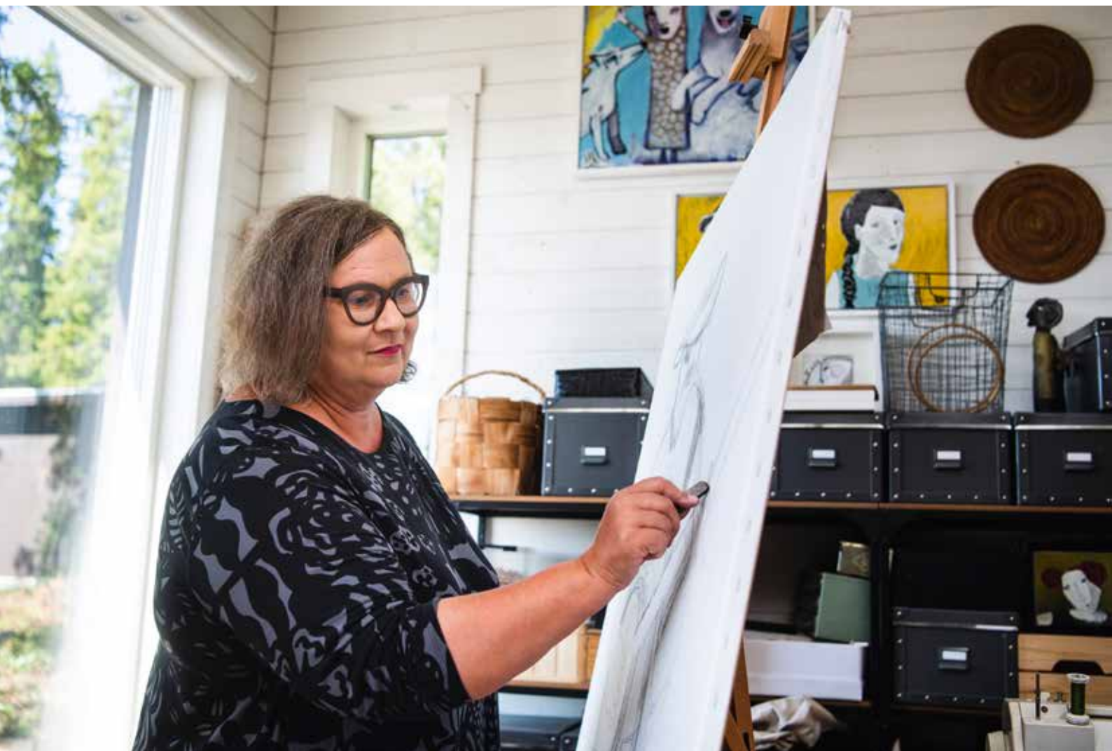
Inger påbörjar en ny tavla genom att skissa med ett grafitstift.

– Plötsligt såg jag att jag målat min familj och att det handlade om pro-