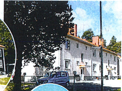
Hyreshus med många smålägenheter. Såld

sion medan komministerbostaden, som dock inte användes som tjänstebostad, var en svårare nöt att knäcka.