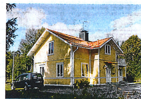
Träffa på tvärgata till kyrkan. Såld