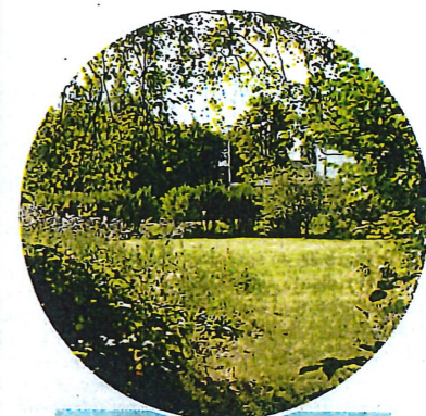
Här nära kyrkan, stod komministerbostaden. Riven