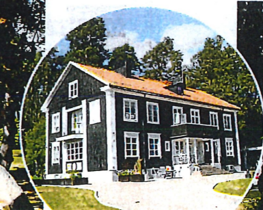
Gamla ålderdomshemmet. Såld