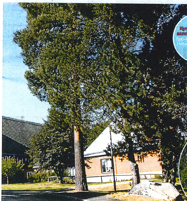
Kyrkan och församlingshemmet, fysiskt centrum för Hofors församling.