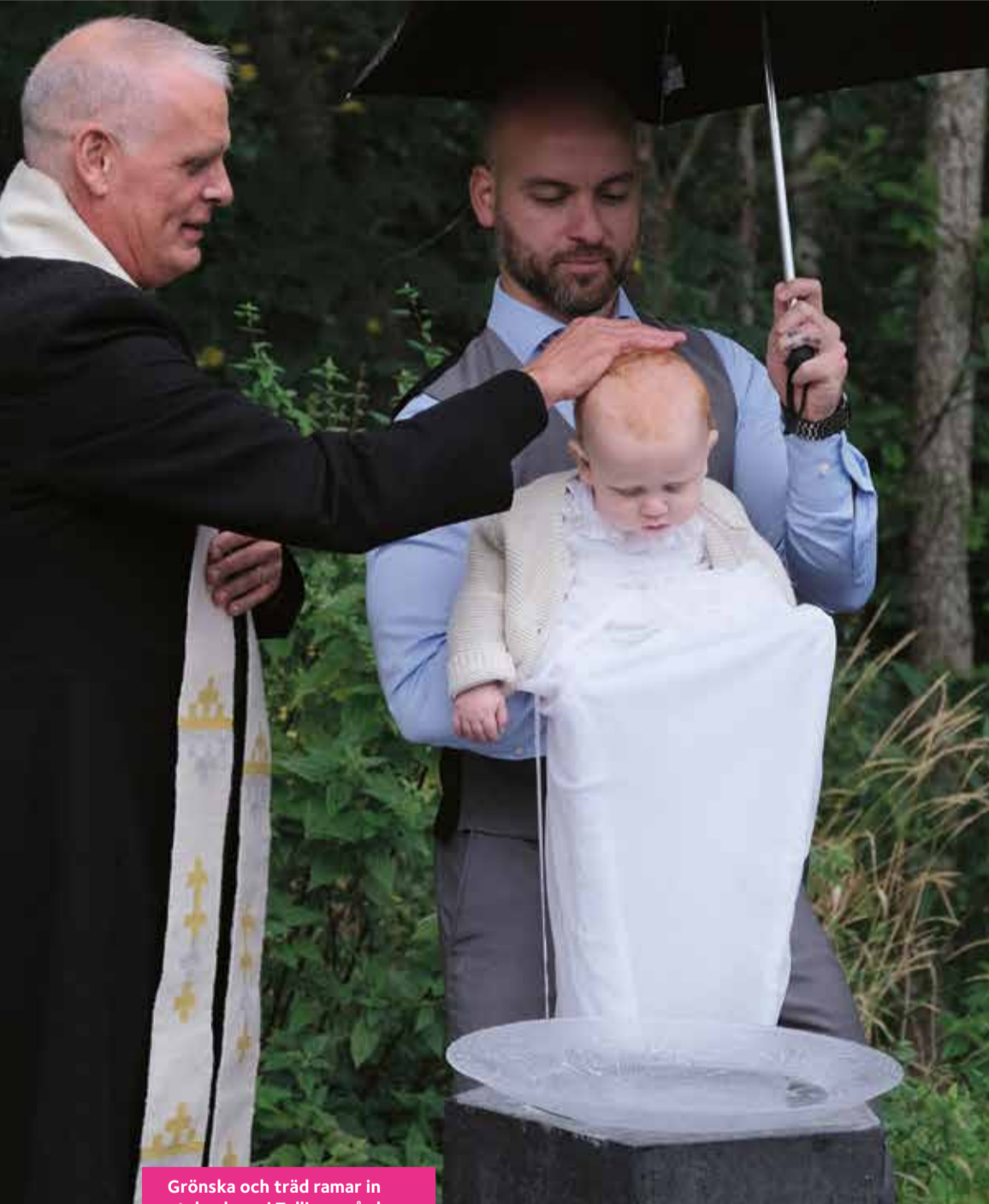
Grönska och träd ramar in utekyrkan vi Tullinge gård.