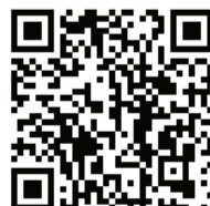
ILLUSTRATION: Stina Löfgren

PÅ SVENSKAKYRKAN.SE/SORRG/FORSTA-HJALPEN-VID-SORRG FINNS TIPSEN FÖR NEDLADDNING. DÄR FINNS ÄVEN TIPSEN PÅ FLERA ANDRA OLIKA SPRÅK (TILL EXEMPEL ENGELSKA, FINSKA, ARBAISKA OCH TECKENSPRÅK)