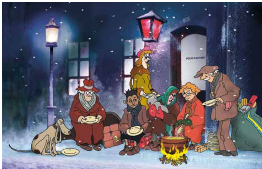
Bilden publicerad med tillstånd av Per Åhlin

att den framförallt kostar i känslan av att förlora sitt människovärde. Kanske man kan göra något? Bjuda in någon ensam granne eller vän till en fika under Kalle och hans vänner. Det kan ju betyda mycket och i alla fall minskar risken att somna. Eller ta med sig personen till Jul i gemenskap på juldagen klockan 12-15, med julbord, musik, lek och glädje i Kyrkettan, Gustavsberg (se sid 4). Det är en av flera insatser som vår församling gör. Vi ordnar även Julkasse (en matkasse till behövande) och en paketinsamling inför julen (se sid 4).