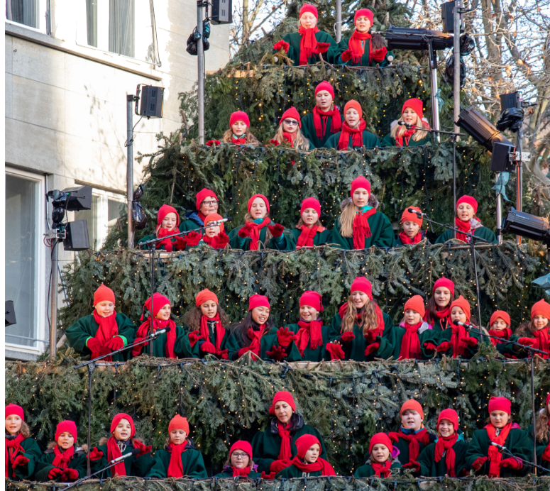
Den sjungande julgranen på Bahnhofstrasse

St. Nicholas firas med rikliga mängder av jordnötter i skal och i choklad, inslagna i rött, blått och grönt folie. Ofta besöker en Nicholas (i form av en utklädd vän, farfar etc) hemmen i Schweiz och frågar om barnen varit snälla.