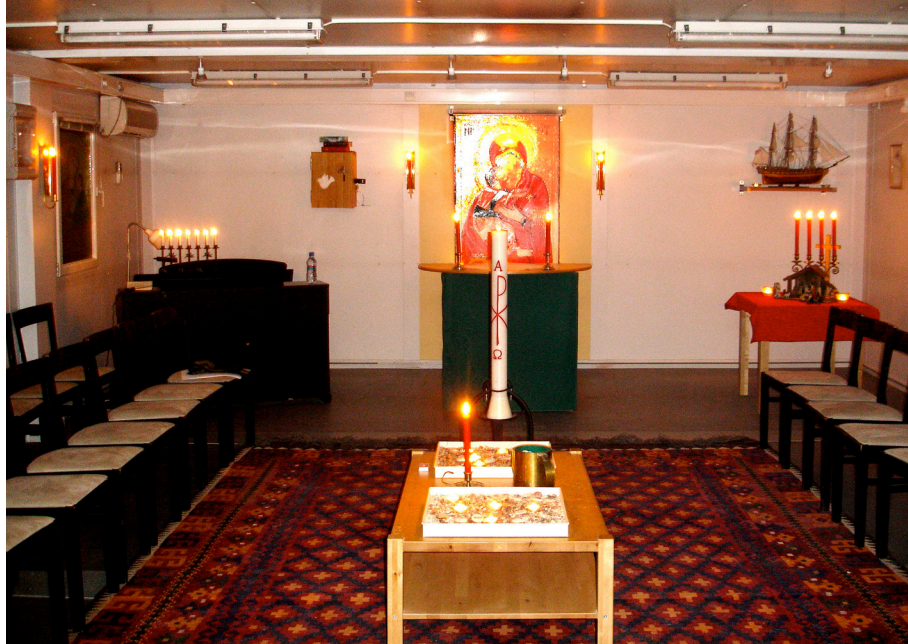
Kyrkolokalen är inredd i en 30-fotscontainer med kamoflagenät

Den här längtan efter traditioner och hemkänsla inger respekt och, faktiskt just där – när vi befinner oss på en insats – är vi utvandrare, landsflyktiga och främlingar i ett kargt land som egentligen inte är vårt eget. För oss blev det väldigt påtagligt. Men när vi närmar oss jul vill vi "komma hem", och framför allt är det hemkänslan som blir viktig.