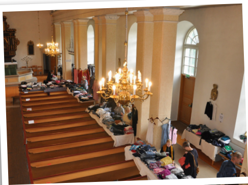
Kläder för stora....