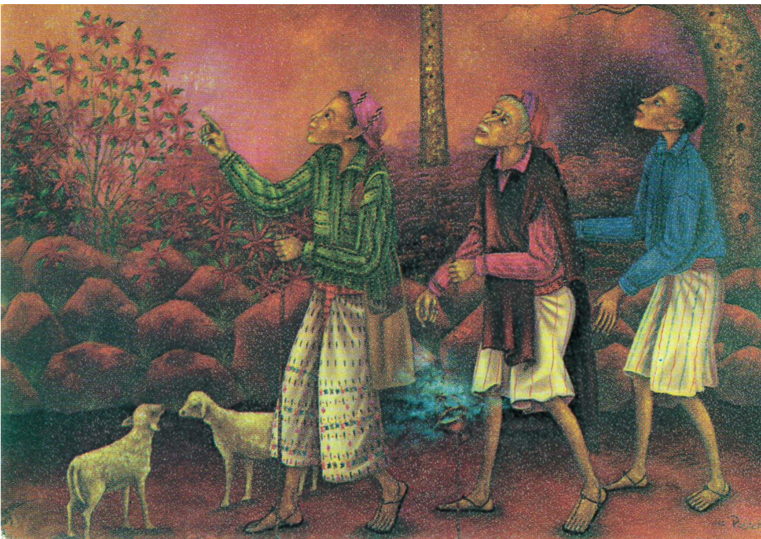
Herdarna på ängen. Bild från Guatemala

Kanske får vi i år göra som familjerna i Guatemala och göra rum till dem som inte kan vara nära men ändå finns i våra hjärtan?