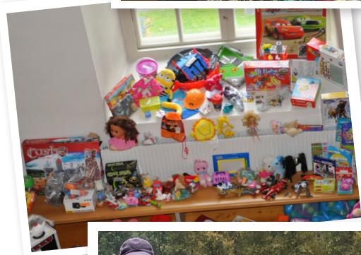
...och lek- saker