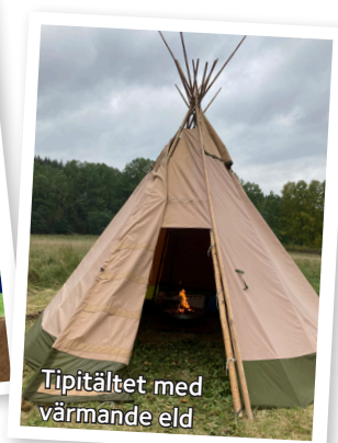
Tipitältet med värmande eld

Det är med glädje jag ser tillbaka på hållbarhetsmarknaden som fyllde Forshälla kyrka och omgivningen runt kyrkan första helgen i oktober. Den fick bli en riktigt fin och glad mötesplats för många människor i Ljungskile- och Forshällabygden, även om den begränsades av coronapandemin.