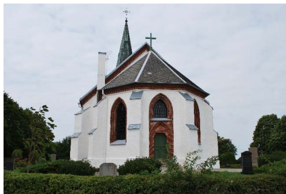
Fasad mot öster.

Kyrkans gjutjärnsfönster från 1871 är spetsbågiga, svartmålade och småspröjsade med blåst klarglas. Fönstren har en omfattning av rött tegel i två språng. Solbänkarna är