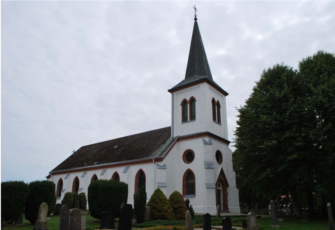
Fasad mot nordväst.