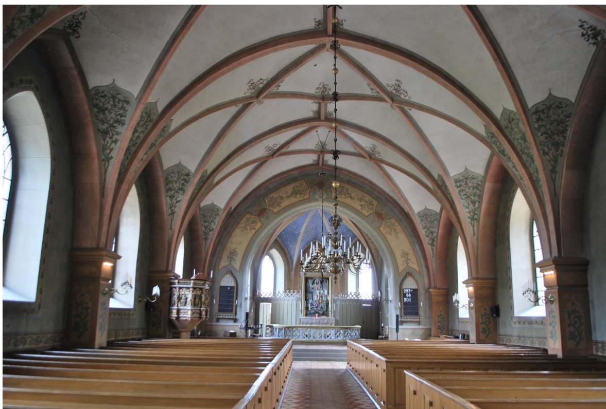
Långhuset mot koret i öster.

I en djup stickbågig öppning sitter en ådringsmålad pardörr med spröjsat färgat glas i övre delen som leder till långhuset.